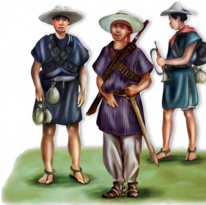
Tropas de indígenas mapaches contrarrevolucionarios de Chiapas.

La guerrilla duró hasta 1920, cuando el general Álvaro Obregón se rebeló contra Venustiano Carranza mediante el Plan de Agua Prieta. A su vez, los mapaches se unieron a Obregón; a la caída de Carranza, los contrarrevolucionarios habían triunfado en Chiapas, por lo que muchas de las leyes que había promovido Castro fueron derogadas. En diciembre de 1920, el mapache Tiburcio Fernández Ruiz fue electo gobernador constitucional de Chiapas.