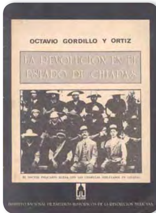
Portada del libro La Revolución en el estado de Chiapas.