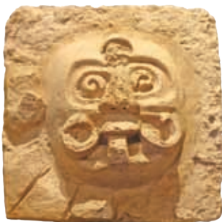
Ak Kin, dios del Sol.

Seguramente has escuchado historias acerca de seres mágicos o hechos sobrenaturales del origen de un pueblo o de los elementos de la naturaleza, como la lluvia, el Sol o la Luna. A nuestros antepasados mayas les contaban sus abuelos y sus padres algunas de esas historias. Por medio de ellas hoy conocemos lo que pensaban de los animales, de las plantas y hasta de las personas.