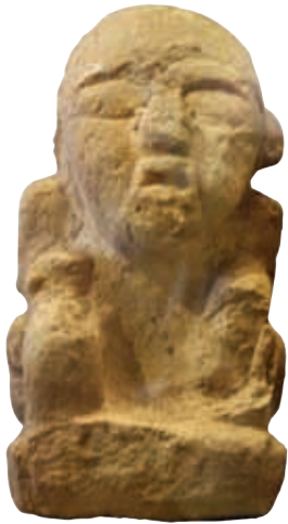
Representación prehispánica del alux.