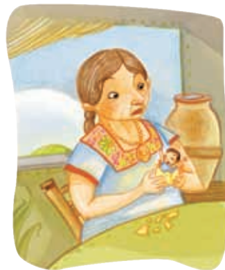
Los mitos narran sucesos fantásticos o irreales.

Y en seguida mandó hacer una estatua de barro [...]. Entonces el pueblo creyó que la estatua hablaba y la adoró. Por esta herejía, los dioses destruyeron Uxmal.