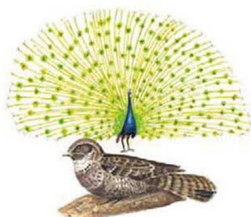
A los pu'ujuy también se les conoce como tapacaminos.

Desde ese entonces, el pu'ujuy decidió salir únicamente de noche. Busca en los caminos al pavo que le robó su plumaje o les pregunta a los caminantes si lo han visto. Por eso se le ve revolotear delante de los que transitan de noche.