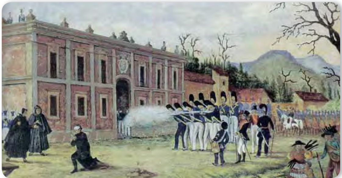
Fusilamiento de Morelos, Museo Histórico de Sitio, Morelia, Michoacán.

A pesar de lo anterior, los insurgentes no avanzaron sobre Chiapas ni Guatemala, pues esta batalla no fue considerada importante, ya que Morelos requería concentrar sus tropas para la lucha que enfrentaba en el centro del país con el ejército realista.