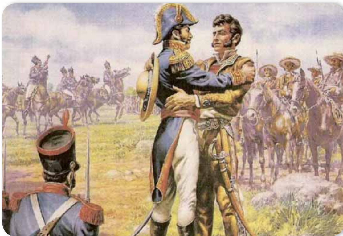
Abrazo de Acatempan, Jesús Helguera.

Agustín de Iturbide fue el encargado de consumar el pacto con Vicente Guerrero, el último jefe insurgente importante. El resultado fue el Plan de Iguala, que consumó la Independencia en 1821.