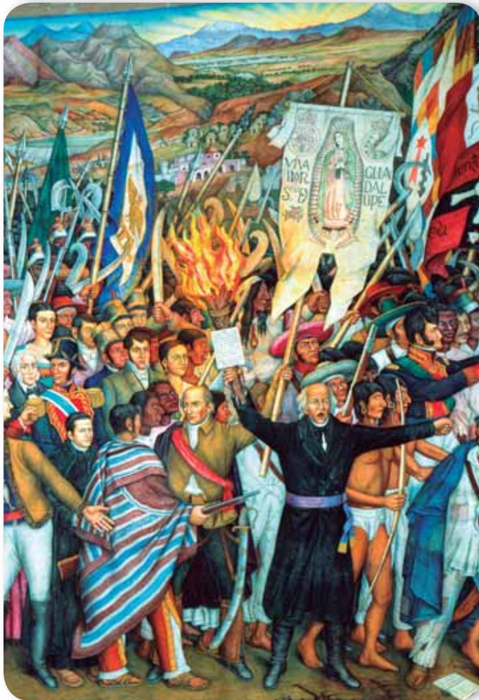
Retablo de la Independencia, obra de Juan O'Gorman

Lo anterior ocurre también en la historia, hay factores que provocan ciertos acontecimientos, y los que acabamos de revisar son causas del movimiento de Independencia.