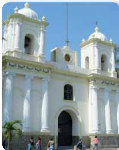
Iglesia de San Agustín

Visita la página web < www.chiapas.gob.mx/ciudades-coloniales >, en la que se mencionan algunas ciudades de la época del Virreinato que hoy son atractivos turísticos. ¿Cuál o cuáles conoces? ¿Cuáles te gustaría conocer?