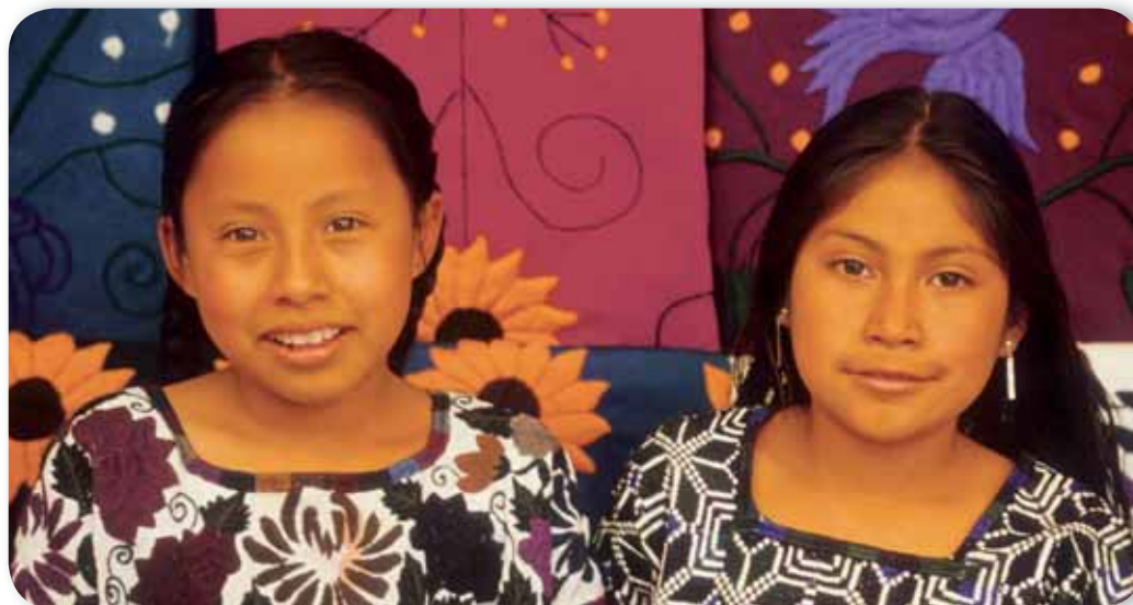
Niñas tzotziles de Zinacantán.

Los españoles derrotaron a los mexicas, pueblo que a principios del siglo XVI era el más poderoso de Mesoamérica. De esta manera, comenzaron a conquistar a otros pueblos hasta que llegaron a Chiapas, que en ese momento no era tan atractivo para los conquistadores, pues no tenían noticias de la existencia de grandes ciudades por estas tierras o de que hubiera oro o plata.