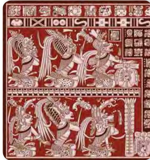
Los señores de Xibalbá.

Otra tradición mitológica maya de gran importancia es la que describe a Xibalbá como el peligroso inframundo habitado por los señores malignos. Se decía que el camino hacia esa tierra estaba plagado de peligros, era escarpado, espinoso y prohibido para los extraños. Xibalbá era gobernado por los señores Vucub-Camé y Hun-Camé.