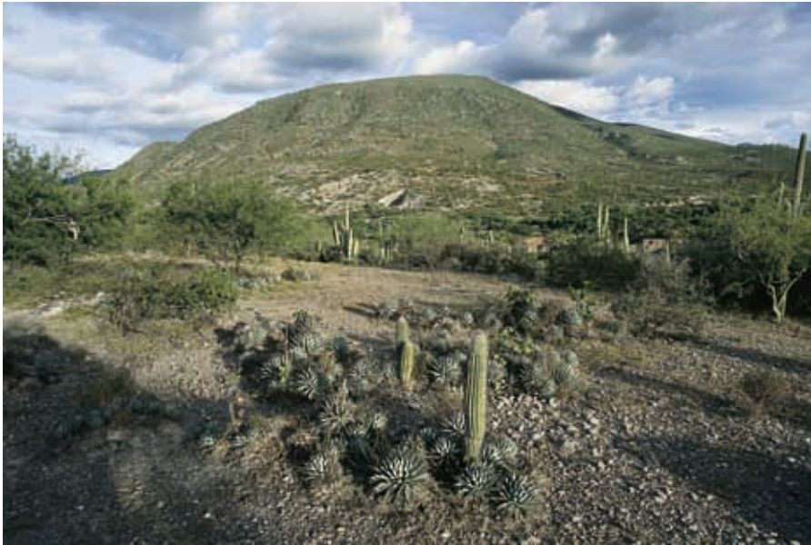
Valle de Tehuacán.

La forma en que crecen las ciudades, el tipo de energía y los medios de transporte que utilizamos, la manera de producir los alimentos, las cosas que compramos y desechamos, todo eso determina tener un ambiente sano o un ambiente enfermo, lo que nos provocaría estar sanos o enfermos, pues formamos parte del ambiente.