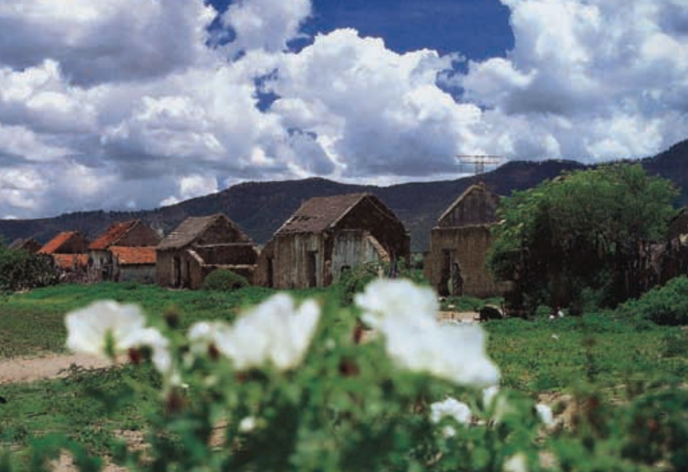
Caserío para los peones de una hacienda.