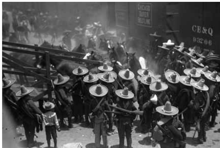
Embarque de caballos.