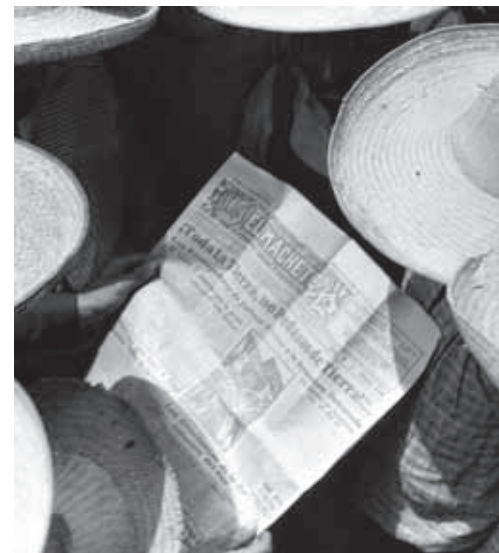
Campeños leyendo el periódico El Machete .