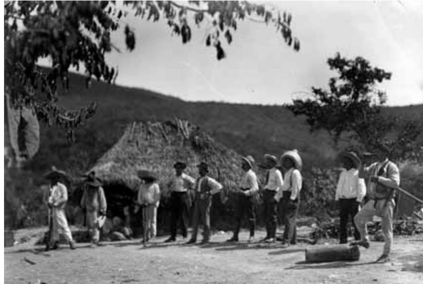
Soldados zapatistas acompañados por reporteros.

Los problemas que acarrearón la repartición de tierras y la explotación en el campo se aunaron a las luchas obreras de la ciudad, lo cual provocó un gran descontento general en la entidad y en el resto del país. En 1910 estalló la Revolución Mexicana, una de las guerras civiles más conocidas en la historia de la humanidad por haber sido una de las primeras luchas emprendidas en favor de los derechos del pueblo.