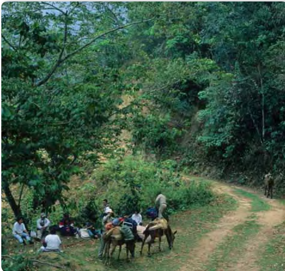
Reserva de la Biosfera El Triunfo, en la Sierra Madre de Chiapas.

El paisaje de un camino te dice muchas cosas acerca de los medios de transporte, las actividades económicas y el grado de desarrollo del lugar. ¿Qué podrías decir de este paisaje?