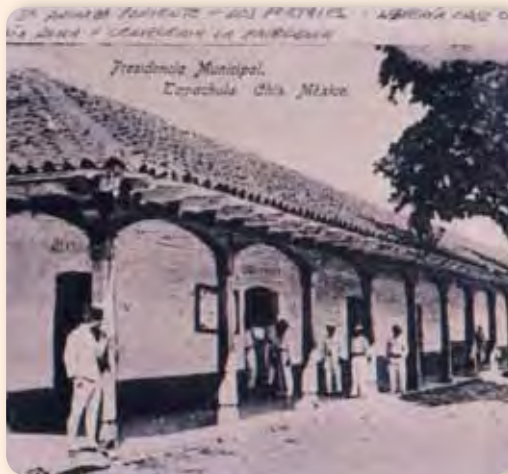
Presidencia municipal de Tapachula, Chiapas, siglo XIX.

Observa las dos fotografías y lee su pie de imagen. Como puedes ver, en ambos casos se trata de la presidencia municipal de Tapachula.