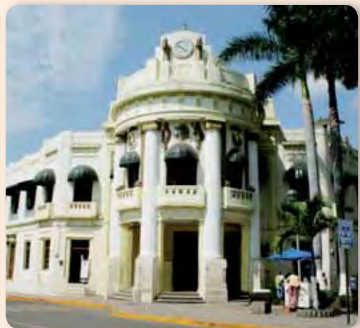
Presidencia municipal de Tapachula, Chiapas, siglo XXI.

Reúnete con dos compañeros y juntos imaginen y comenten cómo era la vida cotidiana de los habitantes del siglo XIX y compárenla con la vida cotidiana en la actualidad.