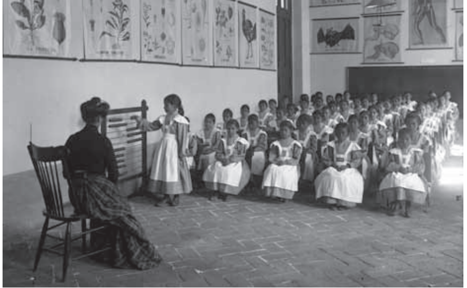
Escuela para niñas.

La noción de educación femenina ha progresado desde entonces, lo cual ha significado un gran logro para las niñas poblanas, que ahora tienen la libertad de estudiar en un futuro la profesión de su elección.