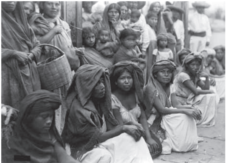
Los beneficios de la modernidad no llegaban a todas las regiones de Puebla.