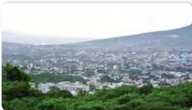
Vista panorámica de Tuxtla Gutiérrez.

Por tu edad, ¿pertenece a la mayoría o a la minoría de la población del estado?