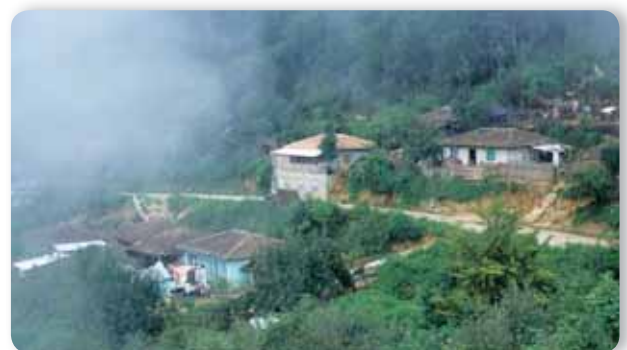
Navenchahuc, Altos de Chiapas.

En Chiapas, 49% de la población es urbana, mientras que en todo el país dicha población representa 78%.