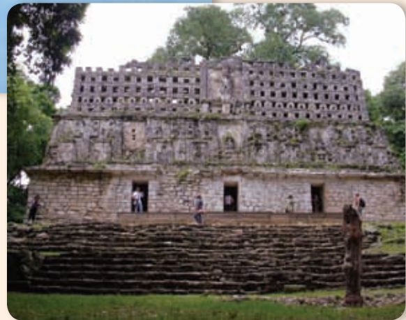
Zona arqueológica de Yaxchilán.

¿Reconoces los lugares que aparecen en las fotografías? ¿Dónde se encuentran? Ambos son de Chiapas y son sólo una muestra de la diversidad de lugares con los que cuenta esta hermosa entidad.