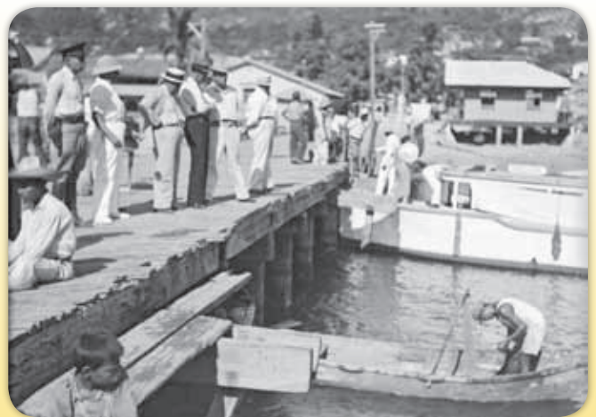
Vista del puerto de Salina Cruz, recién construido.

Transporte marítimo. Debido a la importancia de la ruta transístmica para llegar del Océano Pacífico al Golfo de México e impulsar el comercio internacional, Díaz otorgó a una firma inglesa la concesión para rehabilitar el Ferrocarril Nacional de Tehuantepec. El resultado fue impresionante, pues Salina Cruz, de ser una aldea de pescadores, se convirtió en un importante puerto dotado de modernas instalaciones.