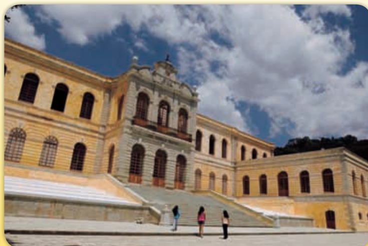
Fábrica de hilados y tejidos en San José Vista Hermosa, ETLA, Oaxaca.

Las principales poblaciones de Oaxaca se caracterizaron por la instalación de pequeñas industrias, modestas fábricas productoras de cerveza, cigarrillos, jabones, calzado y múltiples talleres artesanales.