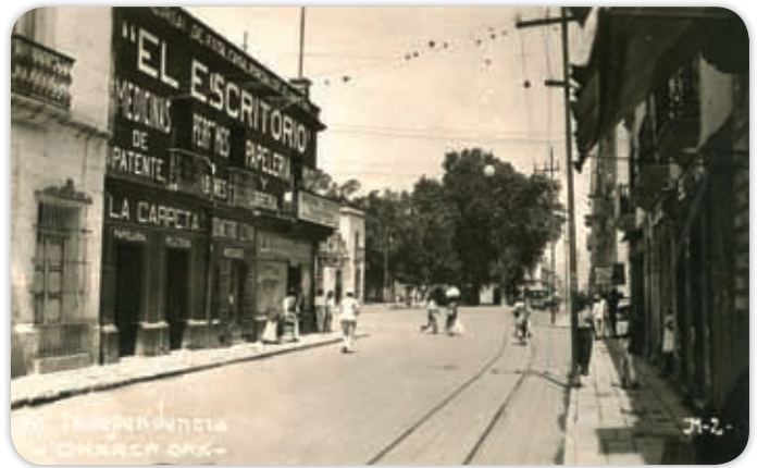
En Oaxaca se desarrolló la industria, calle Independencia en el centro de la ciudad.

En casi todos los distritos de Oaxaca se producían de manera artesanal: azúcar, panela, aguardiente, aceite, jabón, pólvora (para juegos pirotécnicos) y se curtía piel de bovinos y caprinos. Los talleres artesanales caracterizaron y dieron su identidad a los barrios. Los principales productores de hilados estuvieron en Xochimilco, las curtidurías en Jalatlaco y los hortelanos en Trinidad de las Huertas.