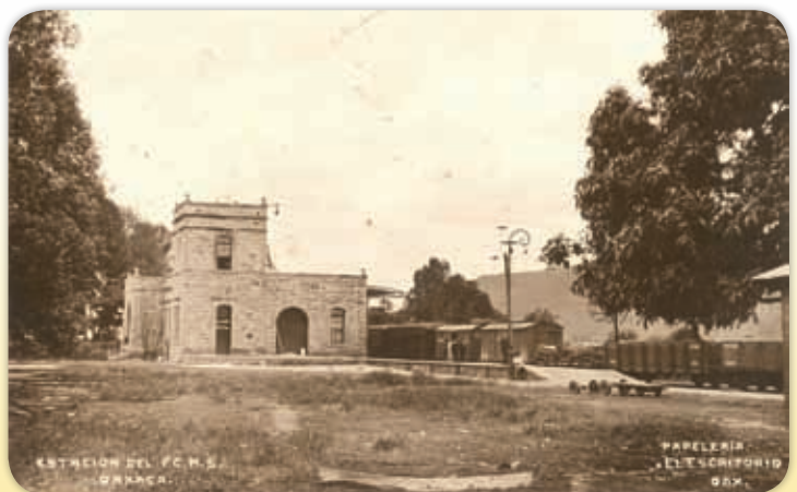
El ferrocarril propició el auge de la minería.

Entre 1895 y 1907, luego de la introducción del ferrocarril, capitalistas norteamericanos e ingleses invirtieron más de 10 millones de dólares en las principales zonas mineras oaxaqueñas: Ixtlán, Ocotlán, Tlacolula, Yautepec, Juquila, Miahuatlán, Ejutla, Tlaxiaco y Tehuantepec. En algunos lugares se incluyeron mejoras tecnológicas como sucedió en el municipio de La Natividad, del distrito de Ixtlán de Juárez y Taviche, en Ocotlán de Morelos.