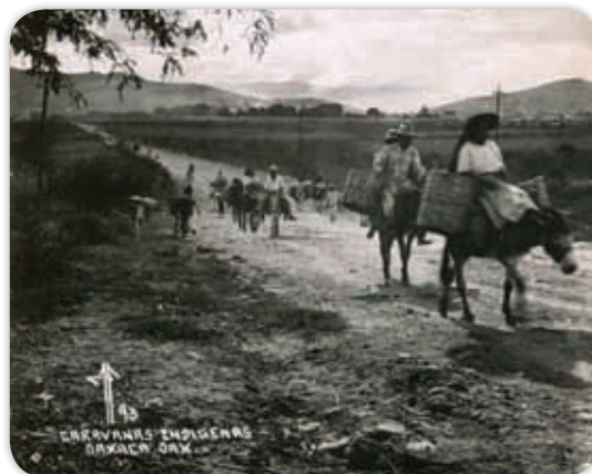
Medios de comunicación utilizados, antes del ferrocarril.

Diligencias y carretas. En la década de 1870 a 1880 funcionó con regularidad, aunque no sin dificultades, un sistema de transporte de tracción animal que comunicaba Tehuacán con Oaxaca: las diligencias. Éstas cubrían en varios días la distancia existente entre ambas ciudades. También transitaban carretas tiradas por bueyes para el traslado de maquinaria, materias primas o las cosechas de los campos de cultivo.