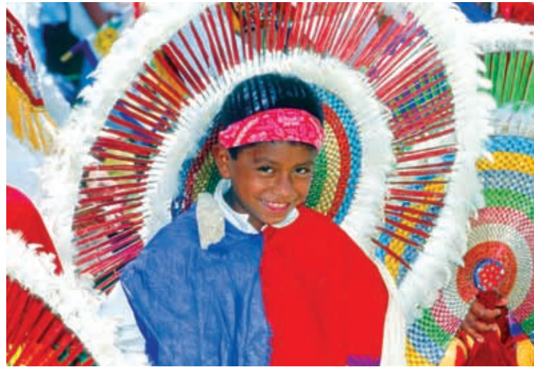
Niño de la Danza de los Quetzales , de Cuetzalan.

La danza de los voladores se ha llevado a cabo entre los nahuas y totonacas de nuestra región desde hace miles de años. Durante la ceremonia participan cinco danzantes, quienes suben a lo alto de un poste, tronco o "palo volador" de 20 metros de altura. Mientras un danzante permanece sentado en la punta del palo tocando música ceremonial con flautas y tambores, los otros cuatro se atan los pies y se lanzan al vacío en posición cabeza abajo. Poco a poco y al ritmo de la música, giran en torno al mástil y van descendiendo hasta tocar el suelo, simbolizando de esta manera la caída de la lluvia, que permite que los cultivos crezcan. En total cada uno de los cuatro danzantes gira trece veces alrededor del mástil de madera, lo cual suma un total de 52 giros, que equivalen a los 52 años que duraba el ciclo del antiguo calendario indígena.