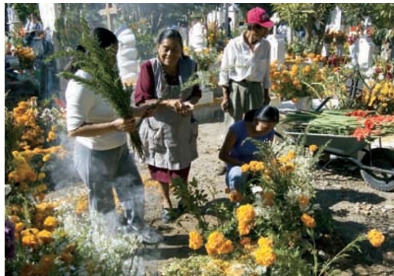
Celebración del Día de Muertos en un cementerio de Puebla.

Apunta tus observaciones en una hoja. También elabora un mapa que refleje cómo están organizados los puestos de tu mercado. Escribe tu nombre y la fecha en tus trabajos y anéxalos a tu portafolio.