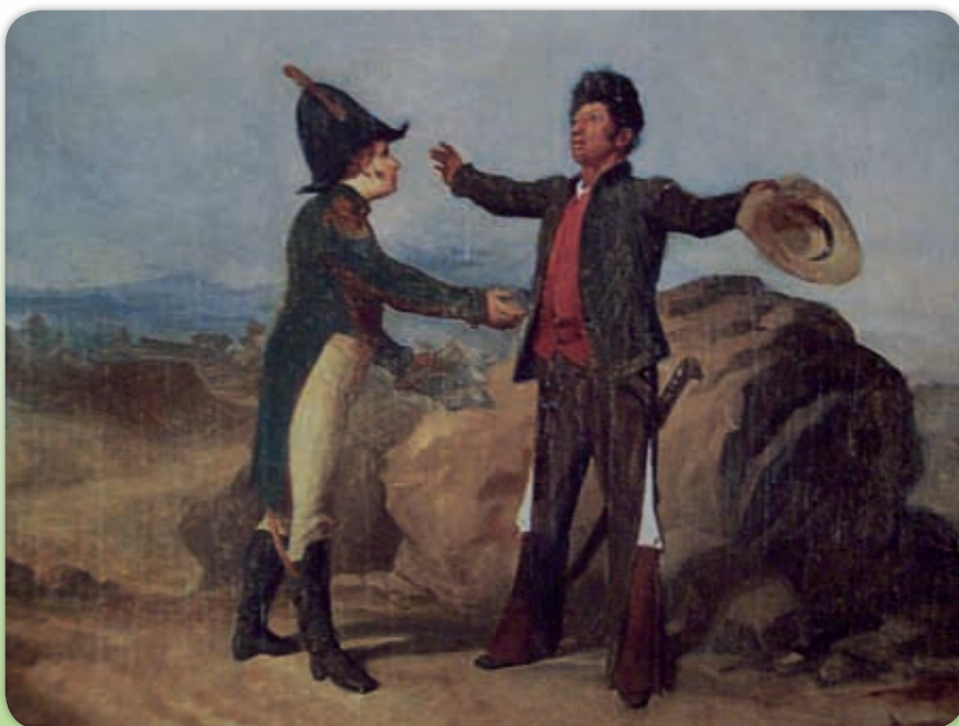
Agustín de Iturbide y Vicente Guerrero firmaron el tratado de las Tres Garantías. En la imagen, el abrazo de Acatempan.