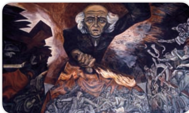
Miguel Hidalgo y Costilla convocó a luchar por la independencia de Nueva España.

En el pueblo de Dolores, cerca de Guanajuato, la madrugada del día 16 de septiembre de 1810, Miguel Hidalgo y Costilla e Ignacio Allende llamaron a la población de Nueva España a luchar por su independencia. A Oaxaca fueron enviados José María Armenta y Miguel López de Lima para buscar simpatizantes de la causa, pero los descubrieron y fusilaron de inmediato.