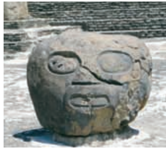
Arriba, estela maya, colección del Museo Amparo. Abajo, cabeza tallada al pie de la Pirámide de Cholula.

En el mundo tolteca, los seres sobrenaturales otorgaban y quitaban, premiaban y castigaban a los humanos según éstos cumplieran u olvidaran sus deberes. Por ello los sacerdotes cuidaban de realizar puntualmente y sin falta los rituales sagrados, al mismo tiempo que aprovechaban para pedir ayuda a los dioses para que las tareas humanas fueran más fáciles y dieran mejores resultados.