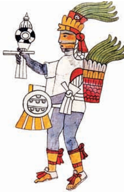
Dios Tezcatlipoca, cuyo nombre, náhuatl, significa "espejo negro por el humo". Códice Florentino

Esta actividad servía para divertir a los habitantes pero también estaba relacionada con rituales religiosos. No se conocen con exactitud las reglas del juego, pero se sabe que existían aros de piedra a un lado y otro de la cancha, por donde los jugadores debían hacer pasar una pelota de hule muy pesada. Al finalizar el juego se sacrificaba a un jugador, como ofrenda a la deidad del Sol. En la ciudad de Cantona se han encontrado hasta 24 juegos de pelota, lo cual hace de este sitio prehispánico el de mayor número de juegos de pelota en todo México. En el sitio arqueológico de Cantona se pueden observar todavía altares para sacrificios humanos, ubicados en la proximidad de la cancha.