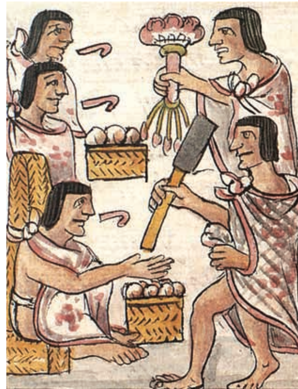
Vendedores de tamales e inspectores de mercados. Códice Florentino.