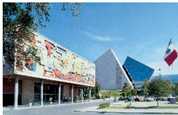
Tecnológico de Monterrey.

✘ Investiga qué carreras puedes estudiar en la universidad.