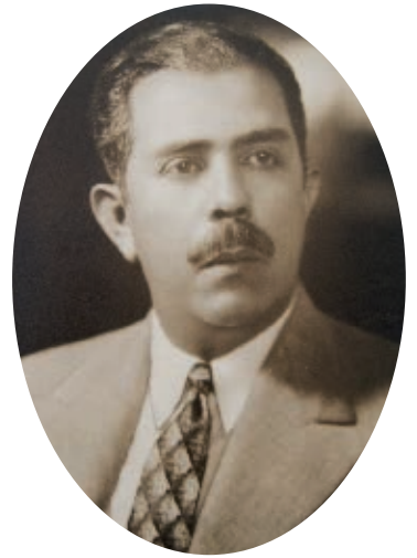
General Lázaro Cárdenas

La cuenca de Burgos es un yacimiento de gas que se explota desde 1945. Cuenta con alrededor de cien pozos que producen una parte importante del gas de México. Tiene una gran extensión que abarca parte de Tamaulipas, Nuevo León y Coahuila.