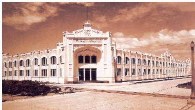
Escuela Industrial y Preparatoria Técnica Álvaro Obregón, Monterrey.

En Nuevo León surgieron las escuelas normales rurales para preparar a los maestros y las escuelas técnicas para formar personal capacitado. En 1930 se fundó la Escuela Industrial Álvaro Obregón, la primera escuela técnica pública.