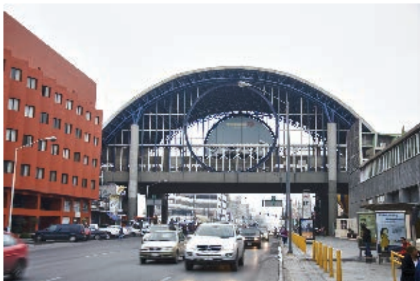
Estación Cuauhtémoc, Metro de Monterrey.

Así, todo fue cambiando, antes se mandaban telegramas y cartas, ahora enviamos mensajes y fotos usando teléfono celular, correo electrónico y diversas redes sociales. ¡Y llegan al instante!