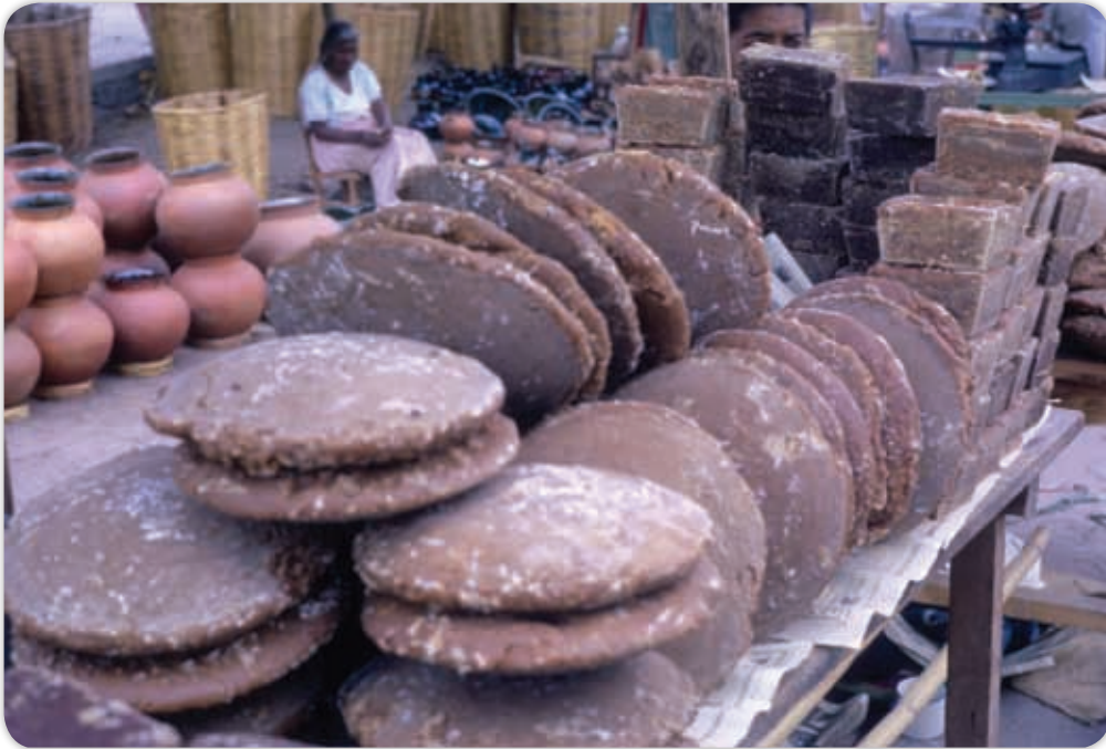
La producción de panela fue una de las principales actividades económicas en la provincia de Antequera.