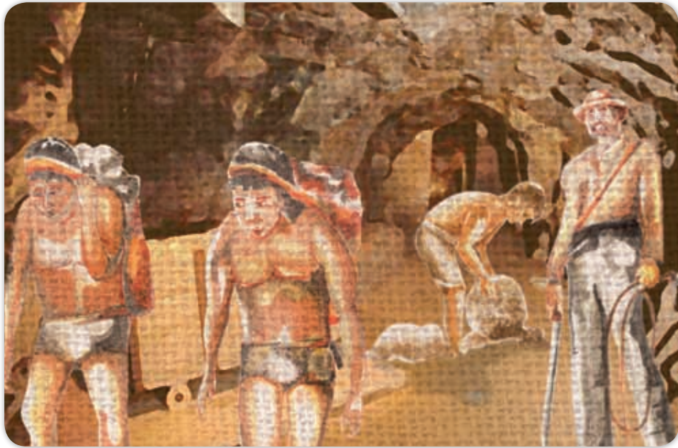
La extracción de minerales en la época del Virreinato se hizo en condiciones muy precarias.