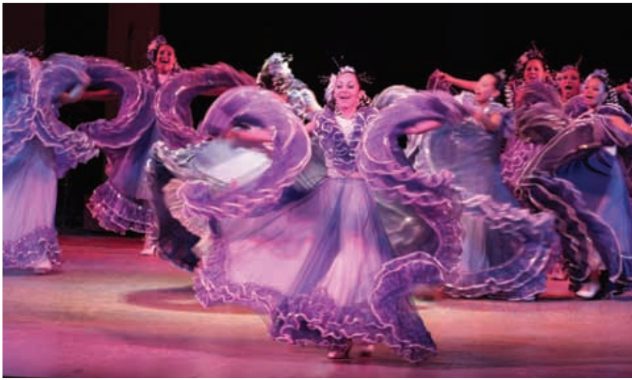
Festival Internacional de Danza.

La variedad de nuestros apreciados platillos en todas las regiones del estado forma parte de nuestro patrimonio cultural. Existen 28 clases de expresiones artesanales y variadas expresiones artísticas, además de grupos de talla internacional, como el Ballet Folkórico Mexcaltitán. Los festivales Amado Nervo, Internacional de Danza, de Acaponeta y de Bahía de Banderas destacan entre más de 20 que se celebran cada año en nuestro estado.