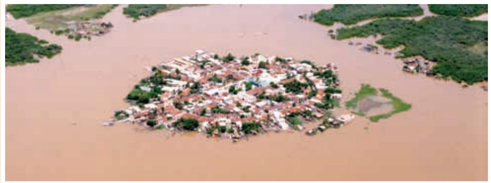
Isla de Mexcaltitán.

Incluye lugares que creas conveniente incorporar en las áreas y presenta argumentos a favor.