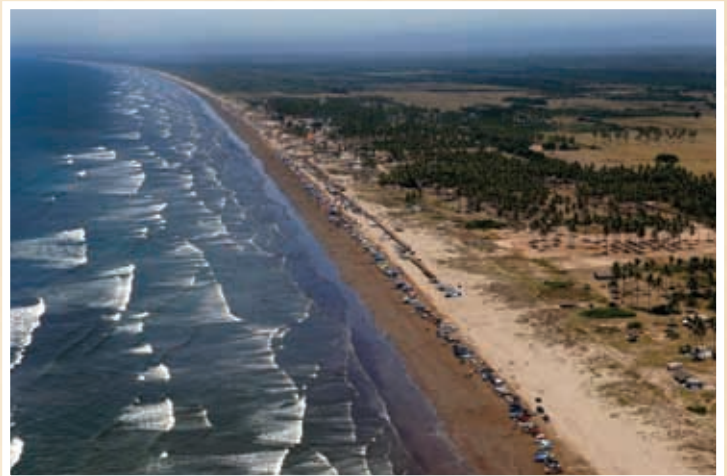
Playa Novillero, Tecuala.