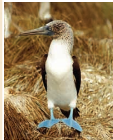
Pájaro bobo patas azules.