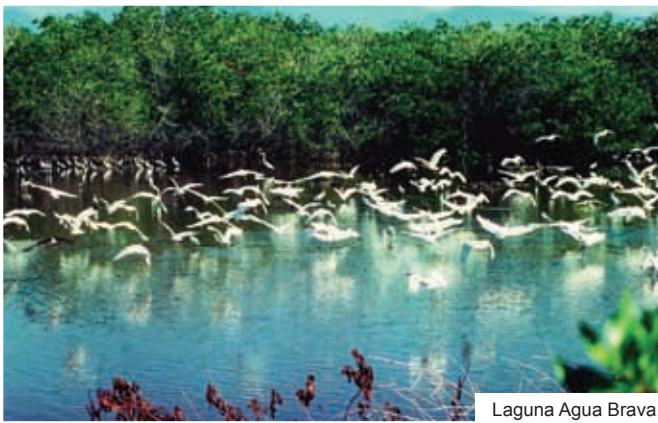
Laguna Agua Brava.

La Cuenca Alimentadora del Distrito de Riego 043 Estado de Nayarit es desde 1949 área de protección de recursos naturales con fines de preservación y cuidado del suelo para garantizar el aprovechamiento óptimo del agua.