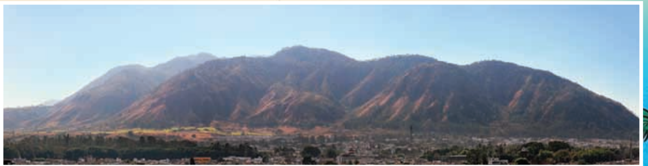
Sierra de San Juan.