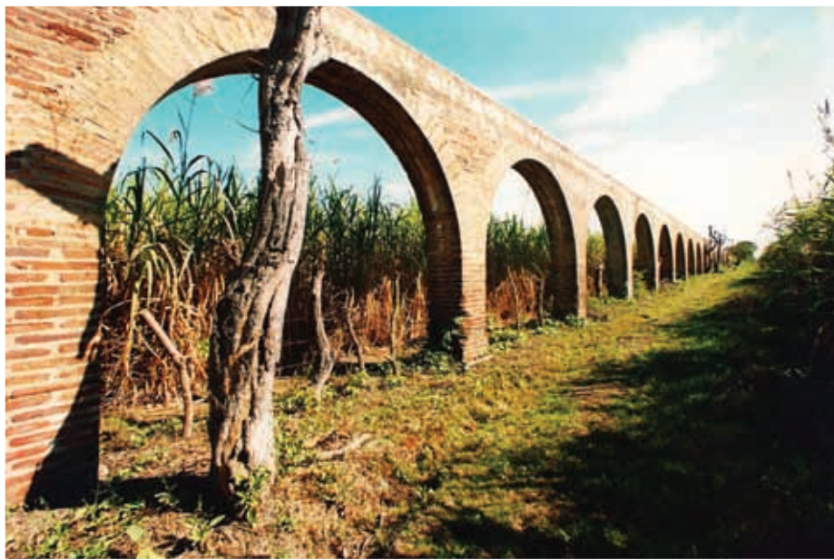
Acueducto de Mora.

Se sugiere exponer por equipos y hacer una monografía.