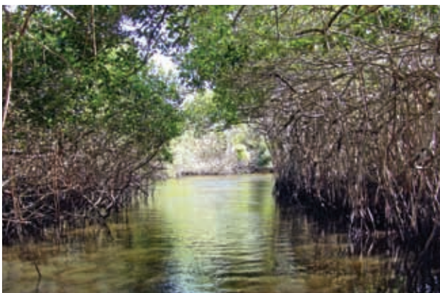
Manglares, La Tovar, San Blas.

En los terrenos húmedos de Acaponeta, Rosamorada, Santiago Ixcuintla, San Blas, Tecuala y Tuxpan, los manglares tienen gran valor ambiental por la captación de carbono, la purificación de las aguas y la protección contra tormentas y huracanes. Representan 20% del total nacional.