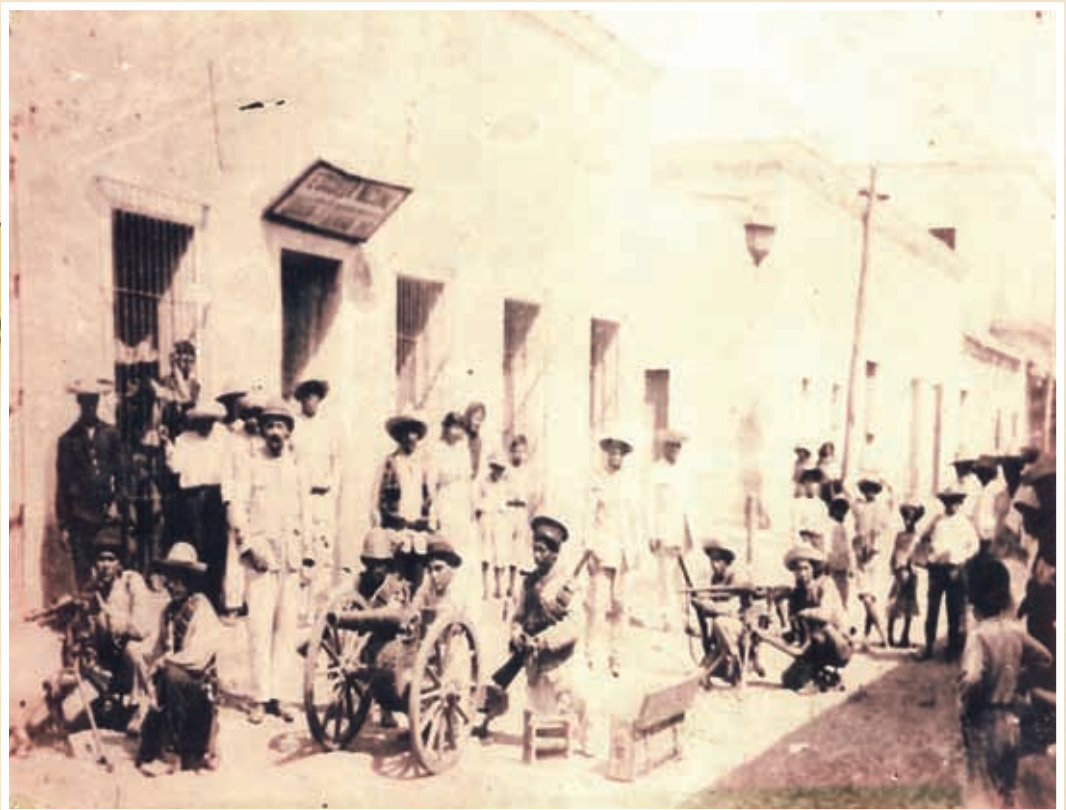
Trinchera de revolucionarios del general Rafael Buelna en Santiago Ixcuintla.