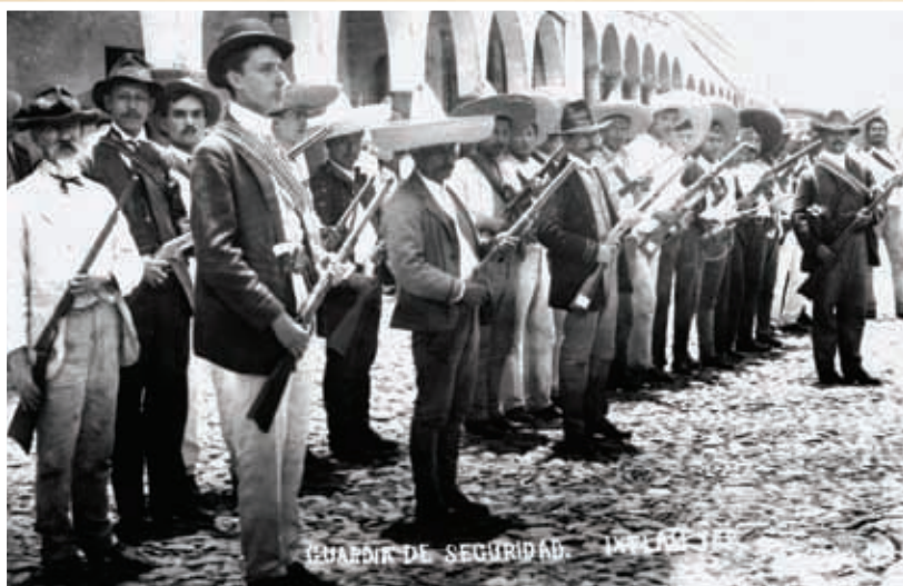
Guardia de seguridad, Ixtlán del Río.