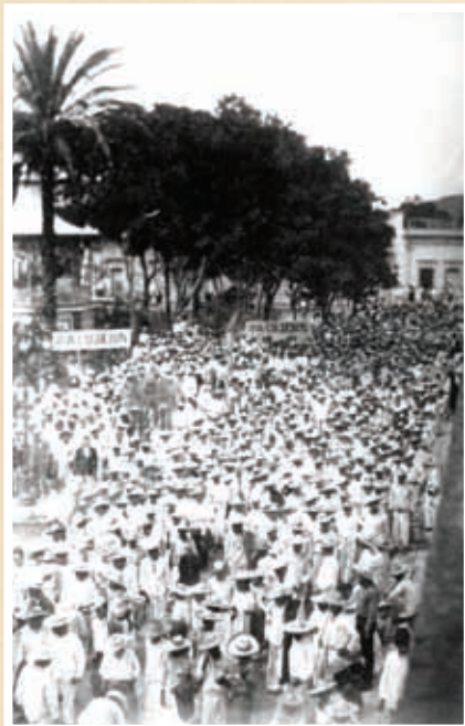
Mitín político de Esteban Baca Calderón en Ixtlán del Río.