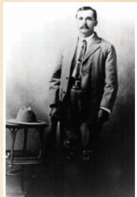
General Esteban Baca Calderón.