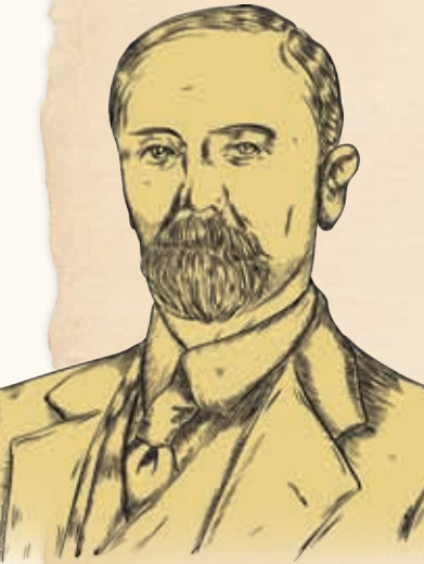
Francisco I. Madero.

Contra el gobierno de Victoriano Huerta destacaron los revolucionarios Rafael Buelna, Manuel M. Diéguez y Lucio Blanco, quienes recuperaron las plazas de Acaponeta, Santiago Ixcuintla y Tepic en 1914.