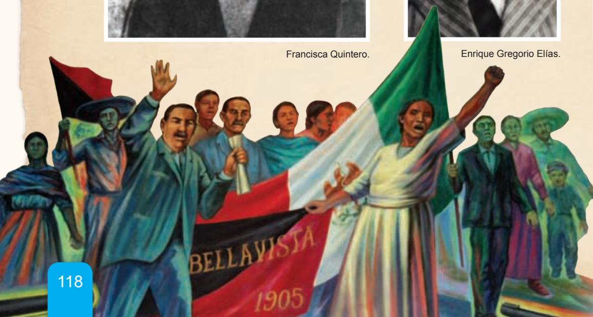
Huelga en Bellavista, 1905 mural de José Luis Soto González.