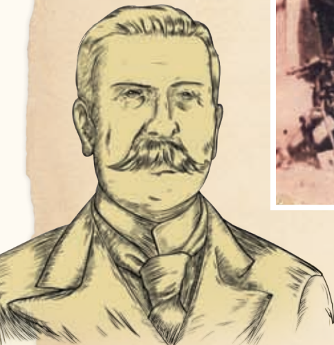
General Porfirio Díaz.