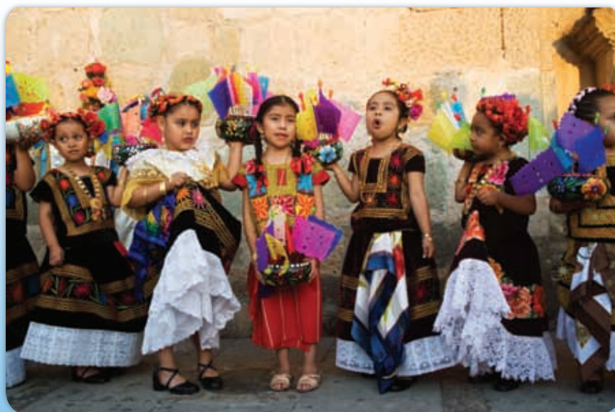
Los vestidos regionales aún se usan en las fiestas tradicionales.

Hasta mediados del siglo xx la forma de vestir de los siglos anteriores permaneció en uso, sin grandes cambios. Los requerimientos de la vida moderna generan que algunas vestimentas se modificaran en Oaxaca, sobre todo en las ciudades.