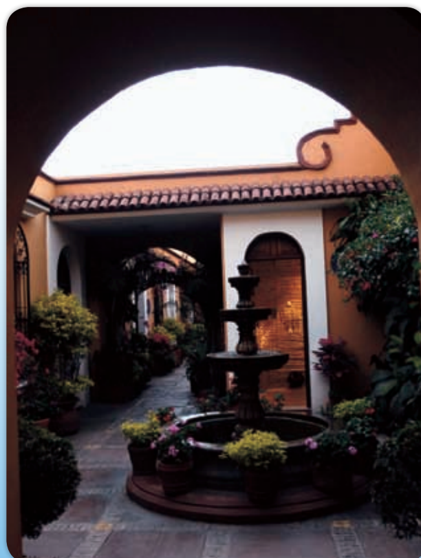
Preservación de la arquitectura de tradición colonial.