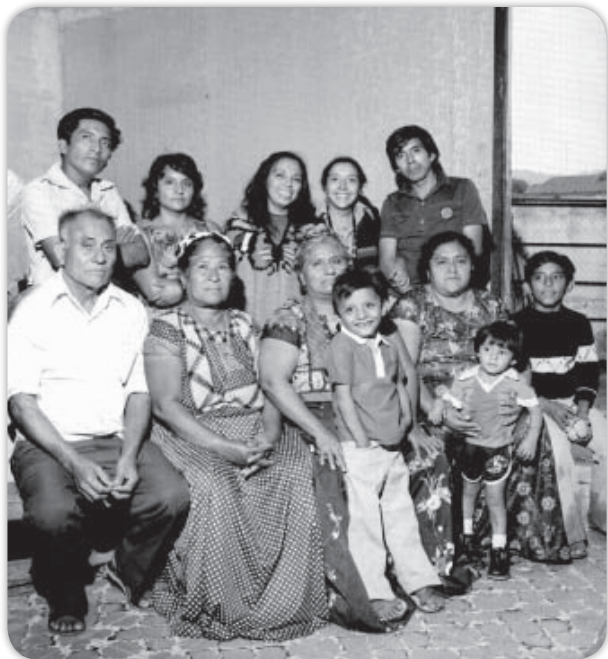
Cambios y permanencias en el vestido.