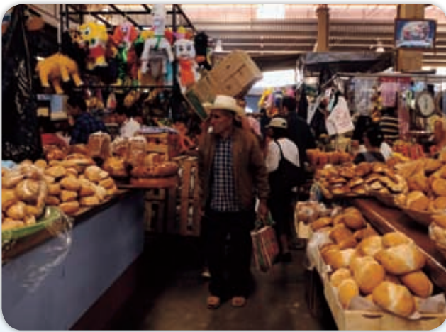
El comercio en las comunidades se desarrolla en los mercados o tianguis.

En la mayor parte de las comunidades oaxaqueñas, los habitantes asisten regularmente al mercado a regatear , vender o comprar mercancía.