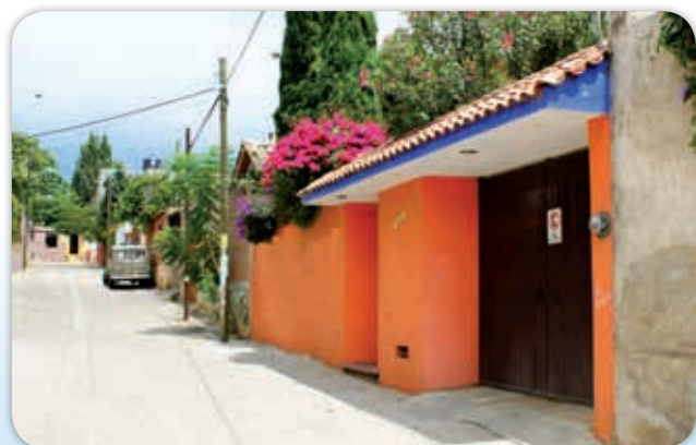
La vivienda urbana moderna se caracteriza por su nuevo diseño.