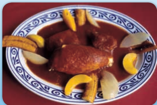
La comida tradicional oaxaqueña.

La comida oaxaqueña fue declarada patrimonio de la humanidad en enero de 2011 debido a su gran diversidad. En los últimos años se están generando cambios en la alimentación de quienes, al igual que tú, habitamos en Oaxaca.