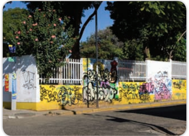
Los paisajes de las comunidades son alterados por elementos culturales externos.

La población migrante, al retornar a sus lugares de origen, refleja la cultura asimilada, esto modifica los entornos tradicionales de las comunidades.