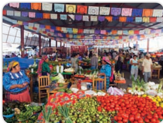
Mercado de Tlacolula, Oaxaca.