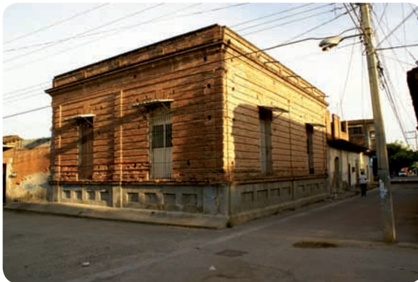
Una antigua vivienda en Tehuantepec.

Es un espacio delimitado de manera común por paredes y techos; ahí las personas preparan sus alimentos, comen, duermen y se asean, protegiéndose del ambiente. Las viviendas en Oaxaca se dividen en antiguas y urbanas.