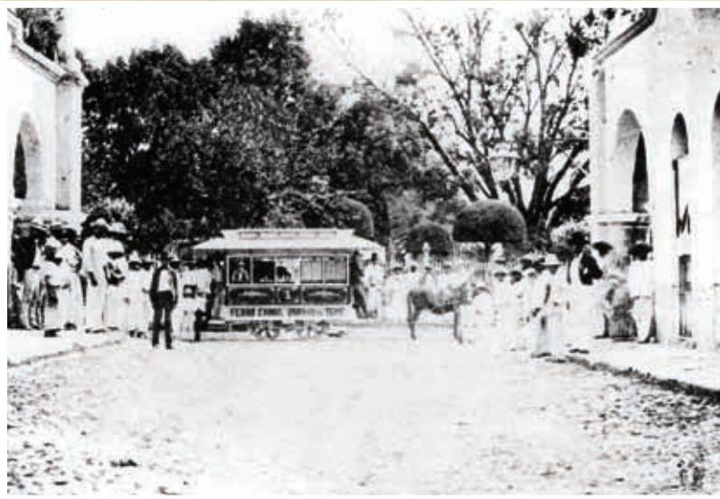
Ferrocarril urbano de Tepic.

Este tiempo fue para Tepic de intensa actividad económica. Se siguieron instalando fábricas con la más avanzada tecnología de la época, que producían jabón, cigarros y puros con materia prima de las regiones de la costa, Compostela y Santiago Ixcuintla.