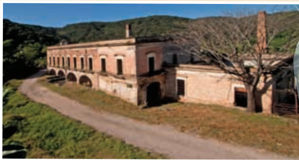
Hacienda de La Escondida.

Observa las imágenes de las haciendas que se muestran en esta página. Investiga qué hacían y cómo vivían los dueños y sus trabajadores. Comparte tu investigación con tus compañeros e integra la información a tu bitácora.