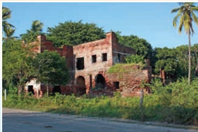
Hacienda de San Cayetano.