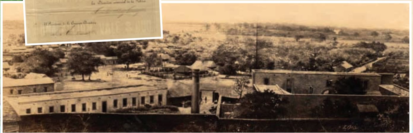
Fábrica de hilados y tejidos en Santiago Ixcuintla.