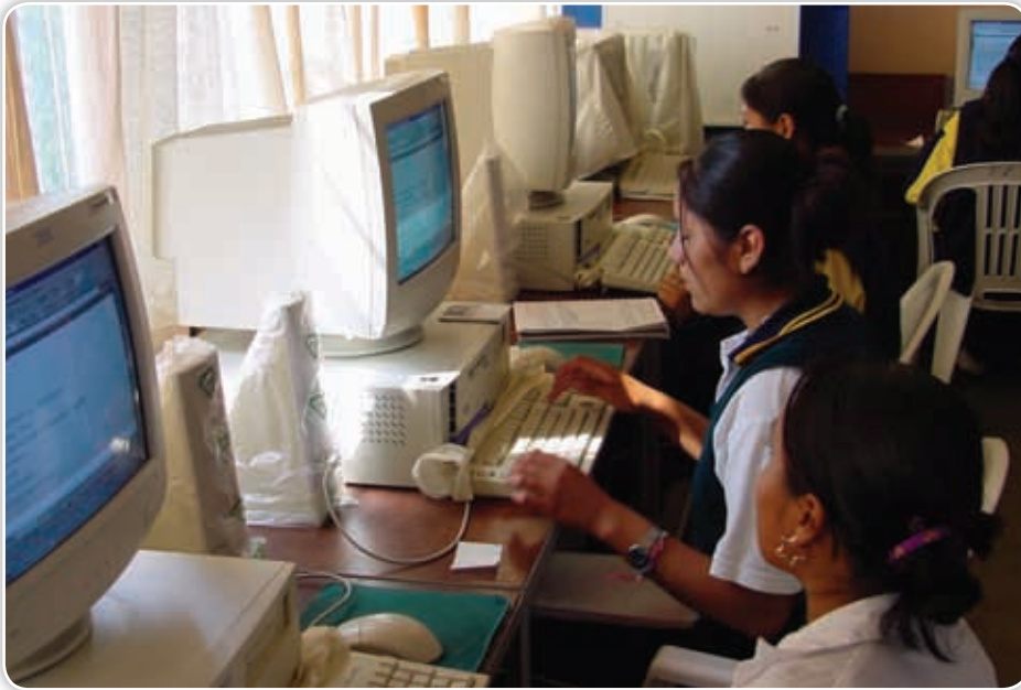
Los alumnos practican computación en la mayoría de las escuelas del estado.

Como seguramente sabes, en la gran mayoría de las actividades que se realizan en escuelas, industrias, oficinas gubernamentales e instituciones médicas ya es indispensable el empleo de computadoras y el acceso a internet.