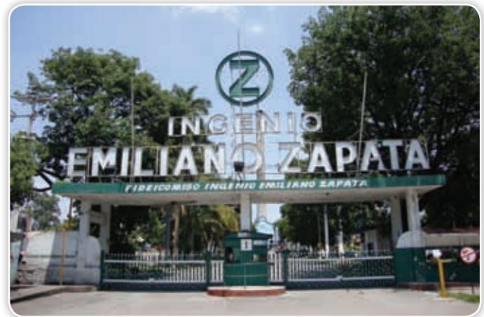
El ingenio Emiliano Zapata, en Zacatepec, es el más importante del estado. Ahí se procesa la caña que se produce en la región.

Uno de los principales logros de la Revolución fue la promulgación de la Constitución Política de los Estados Unidos Mexicanos, en la que se incluyen beneficios como el reparto de tierras por el que luchó el movimiento de Emiliano Zapata, que establece un pacto federal gracias al cual, en 1930, el estado de Morelos elaboró su propia constitución, que sirvió para que los gobiernos y los ciudadanos respetaran sus ordenamientos, en beneficio de todos. La vida constitucional, es decir, apegada a la ley, permitió al estado avanzar en la elección de sus autoridades y en la reactivación de las labores que la gente desarrollaba.