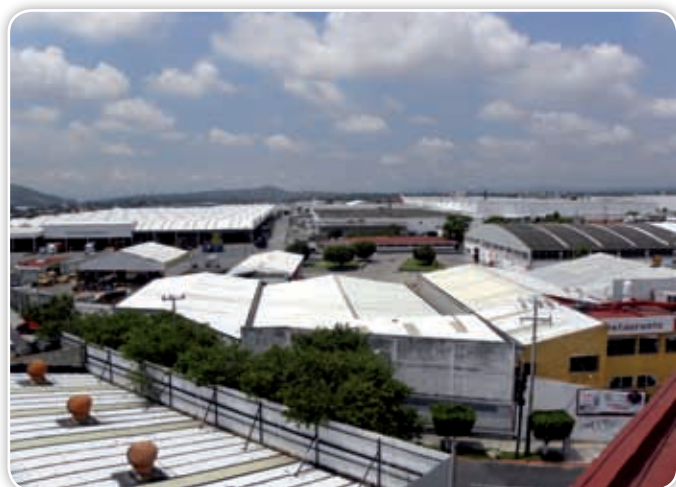
La Ciudad Industrial del Valle de Cuernavaca (Civac), con la diversidad de sus fábricas, proporciona empleo a miles de morelenses y contribuye a la modernización del estado.

manera favoreció a quienes transportan mercancías u otros productos. El mismo beneficio se obtuvo cuando se construyó en 1965 la autopista que pasa por Tepoztlán y Oaxtepec para llegar a Cuautla. Con el paso de los años, la red de carreteras ha seguido modernizándose; actualmente lo puedes observar en el tramo que une a Puebla con Cuautla. Podemos decir que en nuestros días todo Morelos está bien comunicado, y eso favorece las actividades de sus pobladores, además de que resulta conveniente para las fábricas o empresas que deciden instalarse en alguna parte del estado.