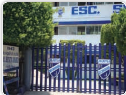
Una de las escuelas secundarias más antiguas de la entidad es la Benito Juárez, en Jojutla.

Gradualmente, los servicios empezaron a llegar a los pueblos: carreteras para comunicarlos entre sí y con las ciudades principales, transporte público, agua entubada, electrificación, pavimentación de calles y más casetas telefónicas, entre otros.