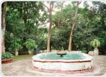
Una fuente en el Jardín Borda, residencia oficial en Cuernavaca de los emperadores Maximiliano y Carlota.

Que muestra la relación del hombre con las plantas.