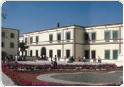
Exhacienda de Chinameca, donde fue asesinado Zapata.

En Morelos hay especialmente tres lugares que podemos visitar para recordar a Zapata: la casa donde nació y vivió con sus padres, en el pueblo de Anenecuilco; el Cuartel General Zapatista, en Tlaltizapán, y la hacienda de Chinameca, donde lo asesinaron.