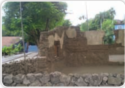
En Anenecuilco se conserva parte de la casa donde Emiliano Zapata nació y vivió con sus padres.