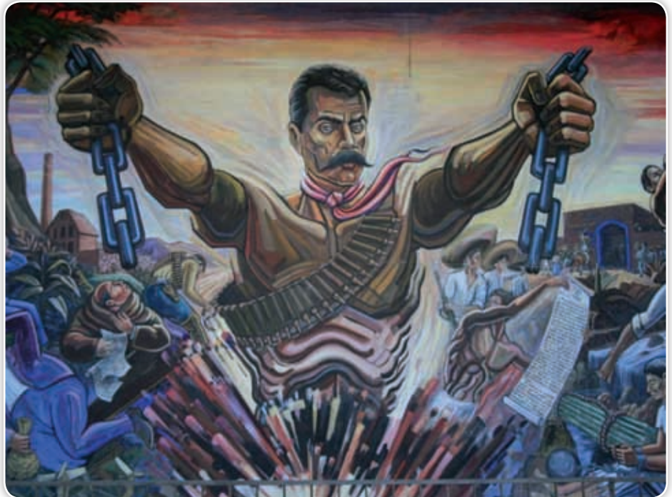
Emiliano Zapata rompiendo las cadenas que simbolizan la opresión y los abusos que vivían los campesinos morelenses durante el Porfiriato. Detalle de mural en Anenecuilco, realizado por Roberto Rodríguez Navarro.

Los morelenses celebramos cada año el natalicio y el aniversario luctuoso de nuestro héroe revolucionario. En los diferentes municipios del estado se organizan variadas actividades; entre ellas, exposiciones que muestran los objetos personales que llevaba el día de su muerte y cabalgatas donde varios jinetes salen de diferentes partes del estado y se reúnen en Chinameca, recordando la última vez que el Caudillo del Sur cabalgó junto a sus hombres. Todas las manifestaciones anteriores son una manera de honrar su recuerdo y de tener presente que la mejor herencia de su lucha es la paz, la libertad y el ser dueños de lo que obtenemos con nuestro trabajo honesto.