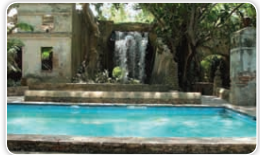
La exhacienda de San Gabriel de las Palmas, en el municipio de Amacuzac, actualmente está convertida en hotel.

Las haciendas que permanecen en el estado son testimonios, en su mayoría, de los hechos ocurridos durante cerca de 300 años en estas tierras: presenciaron injusticias y rebeliones, hambre y prosperidad, muchas batallas y también tiempos de paz. Es indudable que son una parte de nuestro pasado.