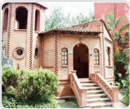
Actualmente, el Castillito de Cuernavaca es un museo fotográfico.

Posiblemente en tu comunidad también existan construcciones, estatuas, fuentes u objetos que tengan su origen en el Porfiriato. Recuerda que son parte de un pasado que nos identifica histórica y culturalmente.