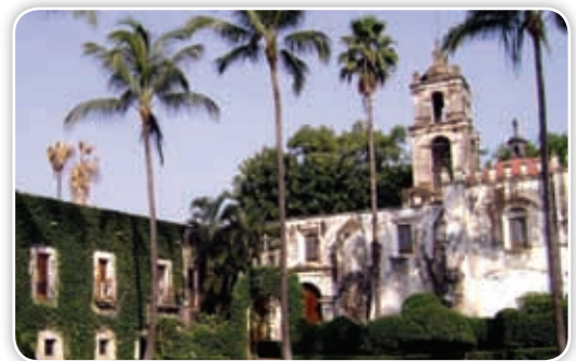
La exhacienda de Temixco es muy visitada por los morelenses y personas de otras entidades que disfrutan de su balneario.