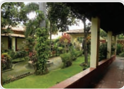
Vista interior de El Olindo, casa de descanso del emperador Maximiliano en Acapantzingo.