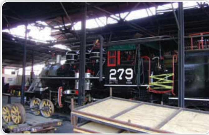
En Cuautla, todavía se utiliza la estación del tren. De ahí parte uno que brinda un corto paseo turístico.

Existen algunas obras construidas durante el Porfiriato que aún puedes visitar. Tres de ellas son las estaciones del ferrocarril en Cuautla, Yautepec y Jojutla. En las dos últimas se conserva el edificio principal, y en Cuautla hasta puedes disfrutar de un breve paseo en tren.