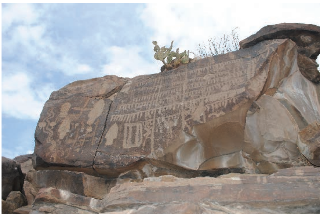
Petrograbado, Presa de la Mula, Mina. Los arqueólogos consideran que representa una cuenta calendárica.