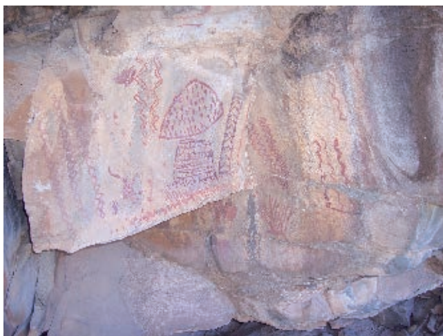
Pinturas rupestres descubiertas en Mina.