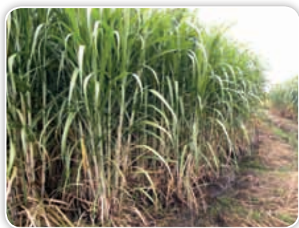
Uno de los principales cultivos en Jojutla sigue siendo la caña de azúcar.

En los ingenios morelenses llegó a producirse la tercera parte del azúcar del país, y el estado ocupaba el tercer lugar mundial en su producción. Esto se logró ampliando cada vez más las zonas que se destinaban al cultivo de caña. En varios casos se despojó a los pueblos de sus tierras, así como del agua que utilizaban para satisfacer sus necesidades básicas.