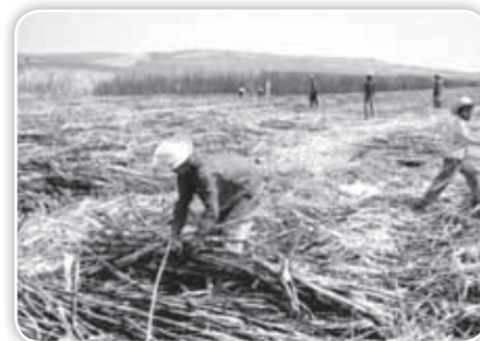
Hombres cortando caña en ingenio azucarero.

También formaban parte de los cambios en el paisaje el paso de los trenes con el ruido de su máquina y el resoplar de su silbato de vapor.