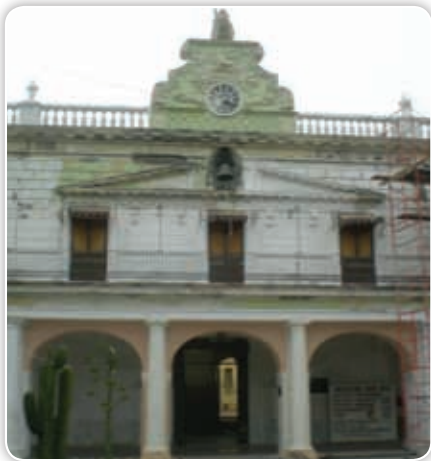
El palacio municipal de Cuautla se construyó durante el Porfiriato. Con frecuencia se le da mantenimiento para conservarlo.

Espacio ocupado por las construcciones principales de una hacienda.