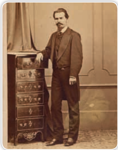
El primer gobernador constitucional del estado de Morelos fue el general Francisco Leyva.