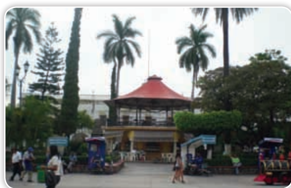
Desde la creación del estado de Morelos, Cuatla ha sido una de las ciudades más importantes debido a sus actividades económicas y al crecimiento de su población.