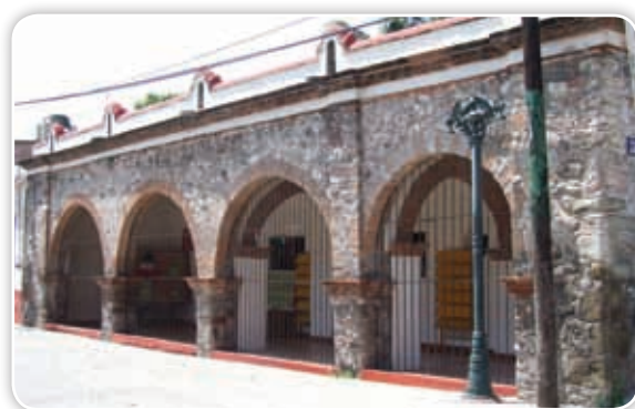
Casa donde se hospedó Benito Juárez a su paso por el pueblo de Tetecala.

Además, se empezó a reconocer el valor de otros lugares por diversas razones: Tetecala por haber hospedado a Benito Juárez durante algunos días; Jantetelco por ser el pueblo donde estuvo Mariano Matamoros antes de incorporarse a la lucha por la independencia;