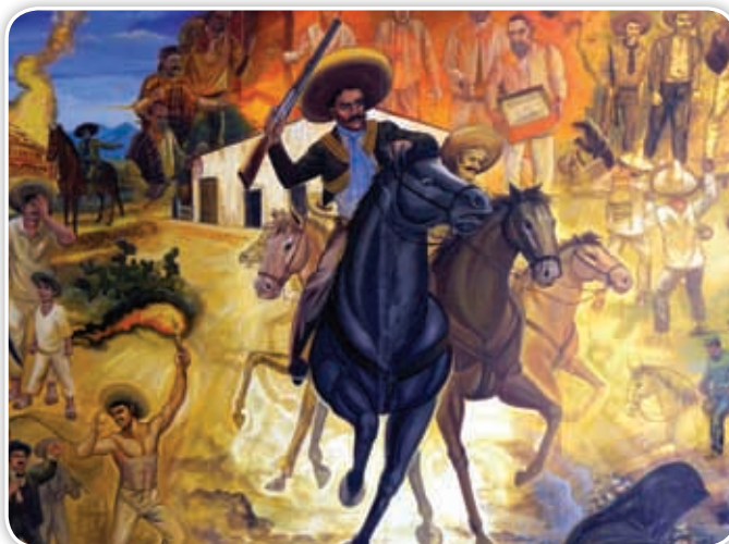
Detalle del mural pintado por Perfecto de la Cruz, en 2002, en la Escuela Normal Superior Benito Juárez. En él plasma la lucha agrarista que encabezó Emiliano Zapata.

Que defiende los intereses de los campesinos.