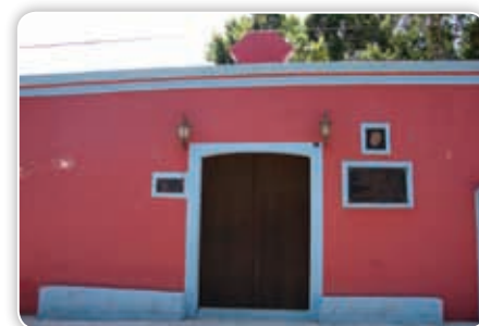
En el pueblo de Tlaltizapán está el edificio donde estuvo el cuartel general zapatista.

Tepalcingo por conservar su feria comercial, que durante mucho tiempo fue considerada una de las más importantes del país; Huitzilac por su ubicación geográfica, que le permitía ser la entrada al estado viniendo de la ciudad de México; Anenecuilco y Chinameca por ser donde nació y murió, respectivamente, Emiliano Zapata, así como Tlaltizapán donde estuvo el cuartel general zapatista. Algunas eran todavía poblaciones pequeñas, pero eso no impidió que fueran reconocidas como lugares sobresalientes del estado de Morelos.