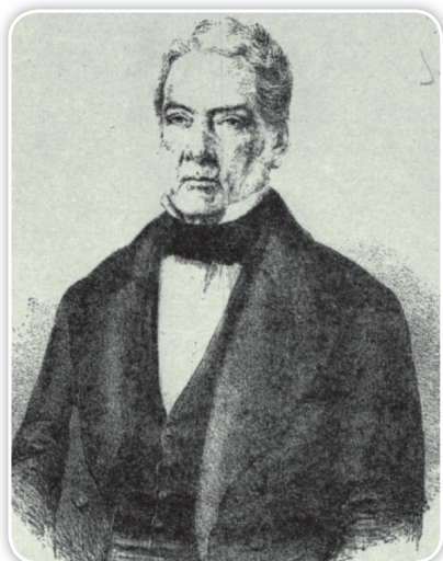
El general Juan Álvarez fue nombrado presidente de México durante su estancia en Cuernavaca.

Publicaron formalmente con el fin de hacer cumplir una ley u otra disposición de la autoridad.