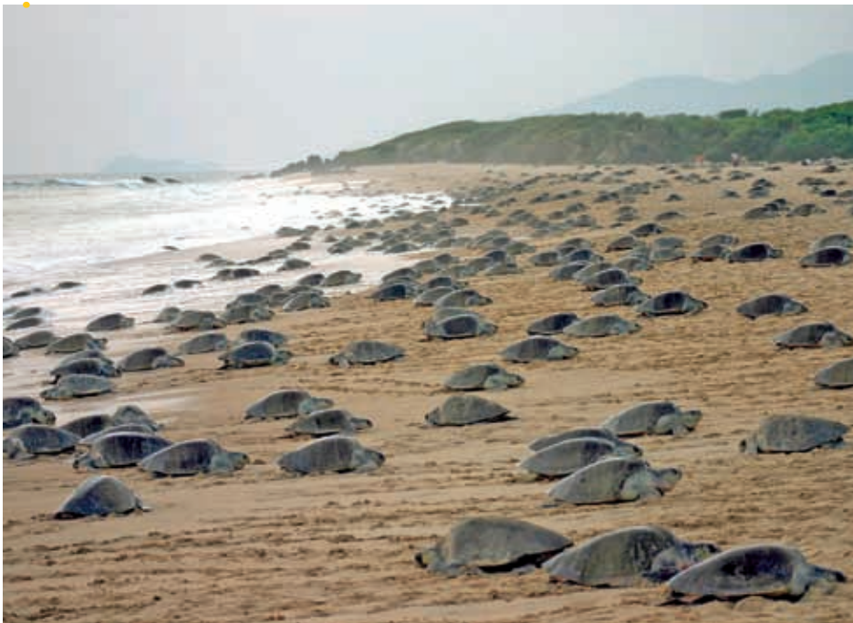
Ixtapilla, en Aquila, está propuesta para ser integrada en la lista de sitios Ramsar.

Ingresa a la página: http://suma.michoacan.gob.mx/ e investiga ahí todo lo relacionado con el cuidado del ambiente en Michoacán.