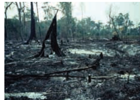
La deforestación daña a miles de especies de plantas y animales.

Los problemas ambientales de Michoacán generan situaciones de peligro para las especies naturales y la población.