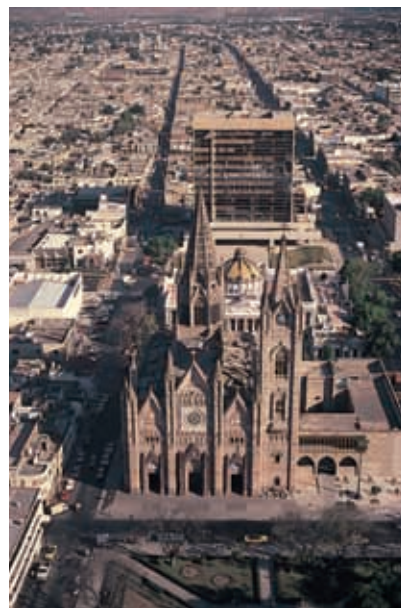
Vista panorámica de la ciudad de Guadalajara.