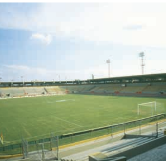
Estadio 3 de Marzo.