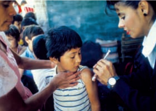
Campaña de vacunación.

El crecimiento de la industria cambió la forma de vida de las personas que habitan en el estado. La población empezó a concentrarse en la ciudad de Guadalajara y en otras de diversa importancia, porque en ellas se establecieron fábricas, diversos negocios, y algunas dependencias de gobierno, motivos por los que surgieron más oportunidades de trabajo.