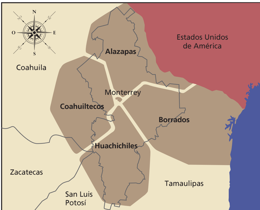
Las tribus chichimecas en Nuevo León, según el historiador Israel Cavazos.

No se conocen los nombres de los primeros pobladores, por lo que les llamamos como los españoles los nombraron alzapapas, coahuiltecos, huachichiles, borrados, rayados, come crudo, pelones, negritos y muchos otros. Existen más de trescientos nombres de bandas y tribus, algunos de los cuales nos recuerdan el lugar donde vivieron: catujanes, en la Mesa de los Catujanes, Lampazos; gualeguas, en Agualeguas, y gualagüises, en Hualahuises. A los grupos de cazadores de esta región se le conoció como chichimecas.