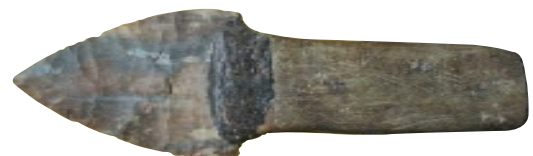
Cuchillo de piedra con mango de madera.

Berrendo. Mamífero cuya parte superior del cuerpo es de color castaño y su vientre es blanco.