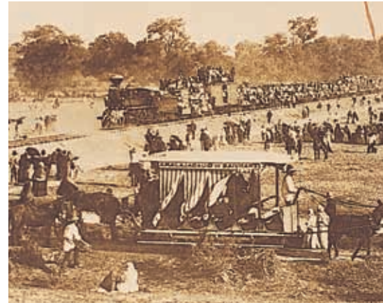
Inauguración del ferrocarril a Guadalajara.

Así, con la ciudad embellecida, los tapatíos empezaron a gozar de las comodidades del progreso.