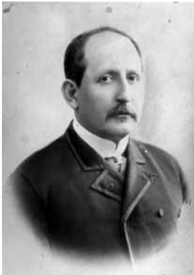
General Ramón Corona.