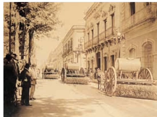
Primeras barredoras en Guadalajara.

Durante la larga gestión al frente del gobierno de Jalisco de Luis C. Curiel el Porfiriato se consolidó entre los jaliscienses; el principio de "orden y progreso" poco a poco se iba imponiendo; se establecieron el Ministerio Público y el Registro Público de la Propiedad, se ampliaron las líneas del telégrafo, se puso en servicio una estación de bomberos en Guadalajara, se creó la banca con dinero jalisciense, se abrieron sucursales del Banco Nacional de México y del Banco de Londres y México.