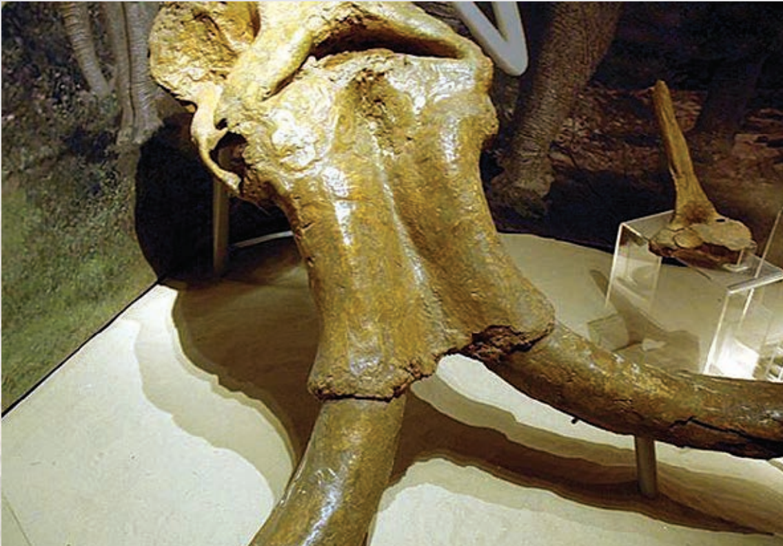
Restos fósiles de un mamut encontrado en Mina.

Los arqueólogos se dedican a estudiar los restos que dejaron los seres humanos que vivieron hace mucho tiempo.