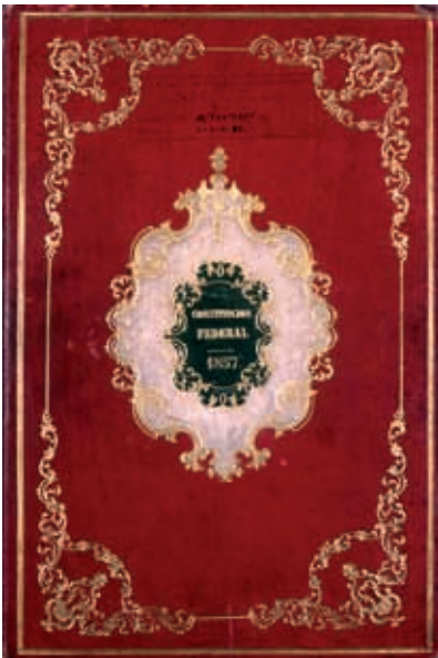
Constitución Federal de los Estados Unidos Mexicanos de 1857.