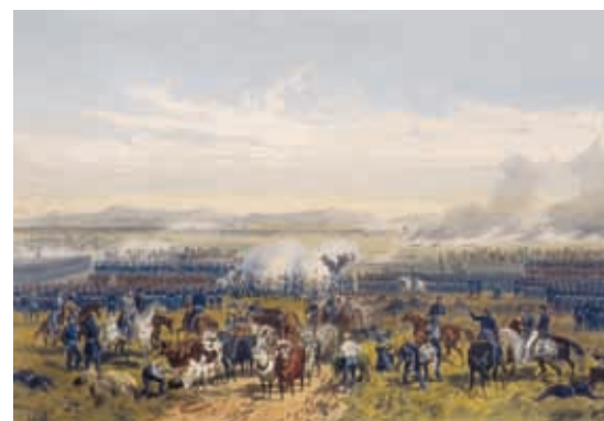
Batalla de Palo Alto.

A partir de 1849, comenzaron a atracar barcos mercantes de grandes dimensiones en Manzanillo, lo que dio lugar a un aumento de población y de comercio en toda la comarca, especialmente en Zapotlán el Grande (actualmente Ciudad Guzmán), ubicado en el camino a Manzanillo.