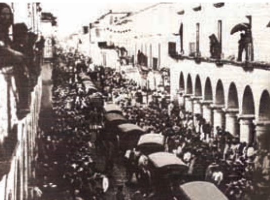
Imagen de la intervención francesa en Jalisco.