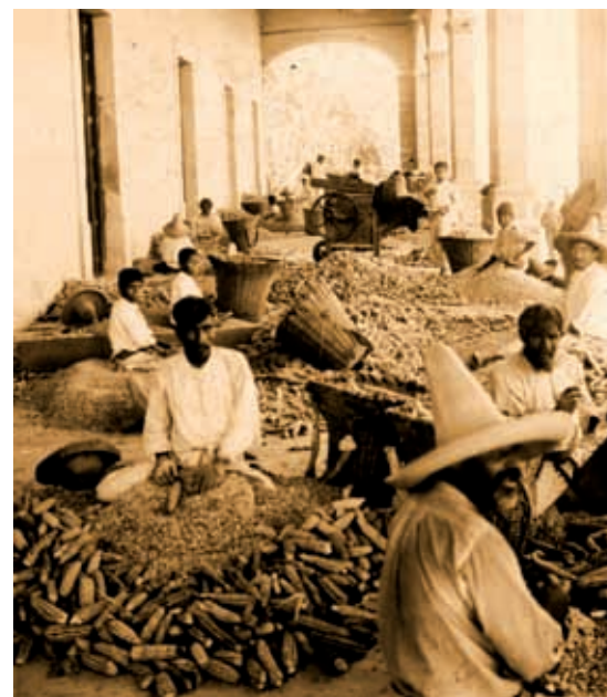
Campeñinos vendiendo maíz en Guadalajara.

Para el año de 1880, en el centro de nuestra entidad, se desarrollaron varias industrias rurales, tales como molinos de trigo y caña, destiladoras de aguardiente, mezcal y fábricas de jabón.