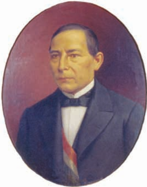
Don Benito Juárez.

Mientras tanto, en Jalisco, las discrepancias no se resolvieron hasta que en 1877 triunfó la revuelta encabezada por Porfirio Díaz y fue ratificado un gobernador partidario del civilismo vallartista.