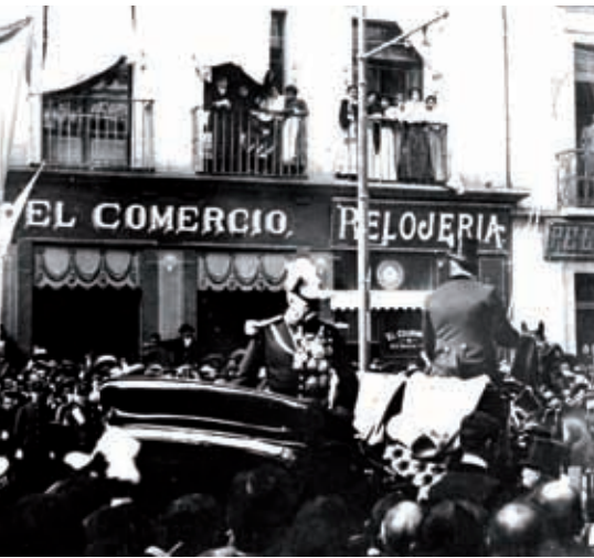
General Porfirio Díaz.