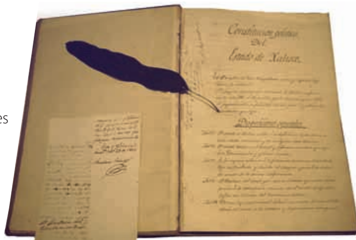
Constitución Política del Estado de Jalisco.

El ejército del centro se hizo presente en agosto de 1834, devolvió al clero sus privilegios y suprimió las leyes que lo perjudicaban; impuso en Jalisco un gobierno obediente que estuviera de acuerdo con establecer un sistema centralista.