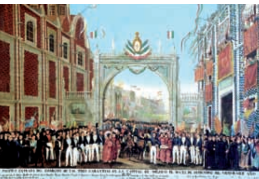
Entrada del Ejército Trigarante a la ciudad de México.

Javier Ocampo, Las ideas de un día. El pueblo mexicano ante la consumación de la Independencia , México, El Colegio de México, 1969, p. 21.