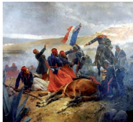
Batalla del 5 de mayo de 1862 (1903).

En junio de 1863 las tropas francesas entraron en la ciudad de México, después de haber ocupado Puebla. El jefe del ejército invasor, mariscal Forey, junto con el embajador de Francia en México, lograron que se le ofreciera el gobierno del país al archiduque de Austria, Maximiliano de Habsburgo.