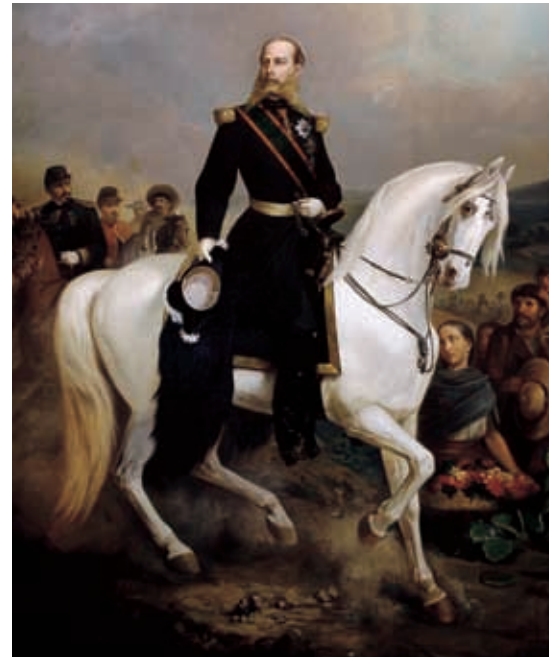
Imagen del emperador Maximiliano.

Con el paso del tiempo, Maximiliano se fue quedando poco a poco solo. Por un lado perdió el apoyo de Napoleón III, y por el otro las fuerzas republicanas fueron ganando terreno. En Jalisco, al ver llegar el fin del imperio, Manuel Lozada se declaró neutral, lo que permitió que el general Ramón Corona recuperara el estado para los liberales. Esta situación se repitió en diferentes lugares del país, hasta que el emperador quedó sitiado en Querétaro, donde fue fusilado en el Cerro de las Campanas al lado de sus principales promotores.