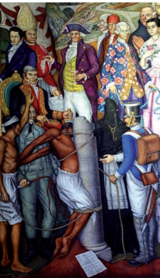
Retablo de la Independencia (1960-1961), detalle, Juan O'Gorman.