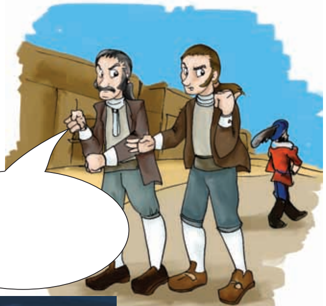
Historieta "Descontento de criollos y mestizos".