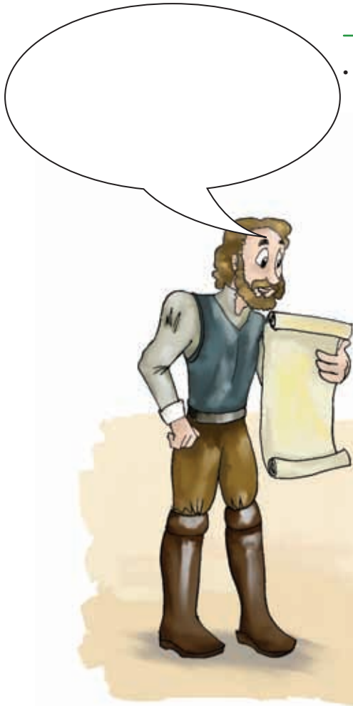
Historieta "Reforma de España".