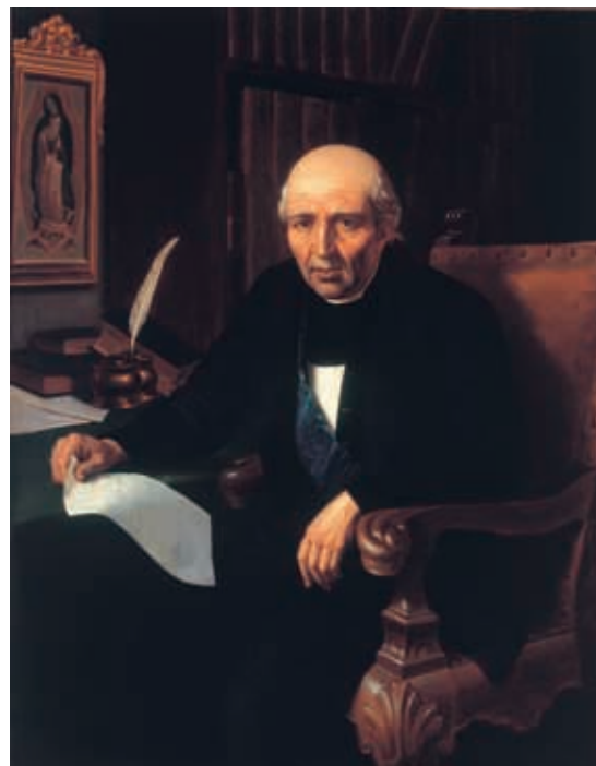
Retrato de Miguel Hidalgo y Costilla.