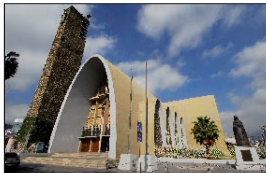
La Purísima en 2005.