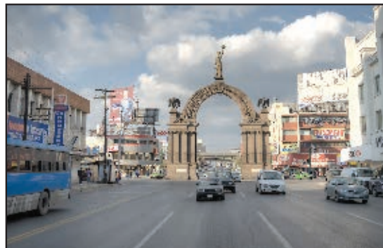
El Arco de la Independencia en 2012.