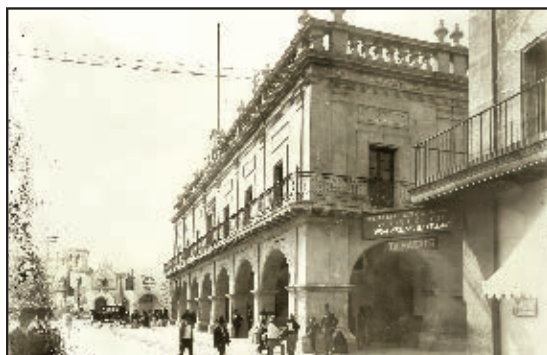
Palacio Municipal de Monterrey en 1910.