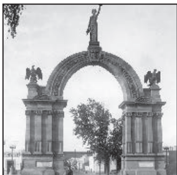
El Arco de la Independencia en 1910.

Observa las fotografías y compáralas. ¿Son iguales?, ¿son diferentes?, ¿sabes dónde están ubicadas estas construcciones?, ¿por qué son importantes para los neoleoneses?