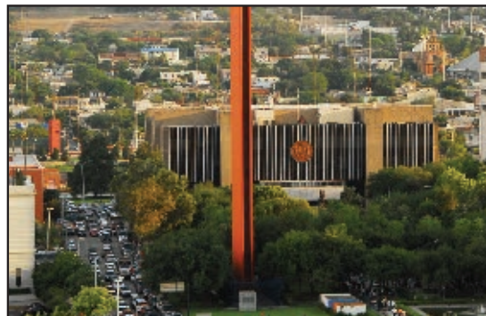
Palacio Municipal de Monterrey en 2005.

Inviten al abuelo de uno de sus compañeros para que les cuente cómo era la vida en su municipio. Todos traigan una foto actual y una muy antigua para que comparen cómo ha cambiado. Hagan un mural y consérvenlo para el proyecto de fin de curso.