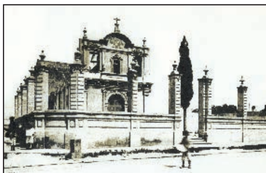
La Purísima en 1920.