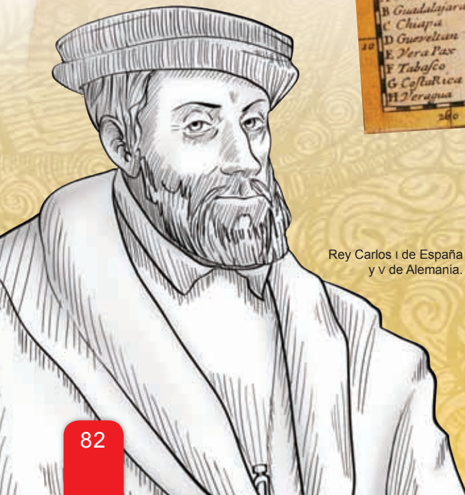
Rey Carlos I de España y V de Alemania.