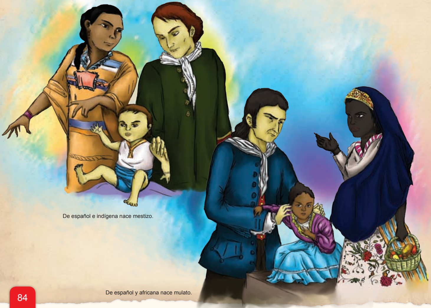
De español e indígena nace mestizo.