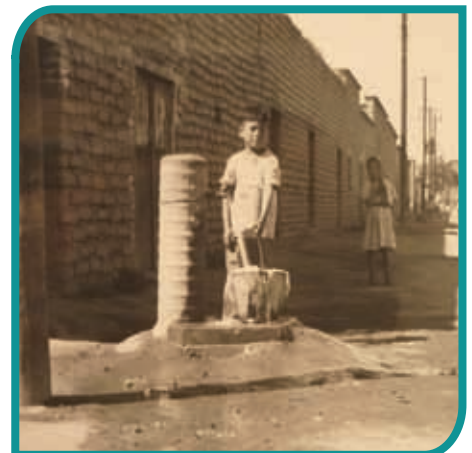
Ampliación de la red de agua potable.

En 1970 se creó la cuenca lechera de Tizayuca; y en 1972, en Tula, se sumaron la refinería de Petróleos Mexicanos y la termoeléctrica de la Comisión Federal de Electricidad, que produce energía para atender las necesidades de la industria y de los centros urbanos. Éstas y otras unidades productivas (textiles y del vestido, metalmecánica y minera), así como establecimientos de los sectores comercial y de servicios, son fuentes de empleo.