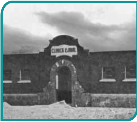
Clínica ejidal en La Estancia, Actopan, hacia 1945.

Las campañas de vacunación han controlado enfermedades como la poliomielitis, la viruela y el sarampión. Otros padecimientos han disminuido gracias a la vigilancia de epidemias y los programas permanentes de atención y prevención del dengue, el cáncer de mama y salud bucal, entre otros. También contribuyen los esfuerzos por mejorar las condiciones de vida con la dotación de vivienda, electrificación, agua potable y drenaje.