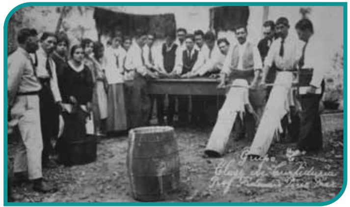
Alumnos y maestros del curso de curtiduría, misión cultural en Zacualtipán, 1923.

cruzada nacional para establecer misiones culturales en zonas muy alejadas y desatendidas. Al llegar a estos lugares, profesionales de la enseñanza convocaban a las personas interesadas para instruir las en docencia y oficios. La primera misión del país se estableció en Zacualtipán en 1923.