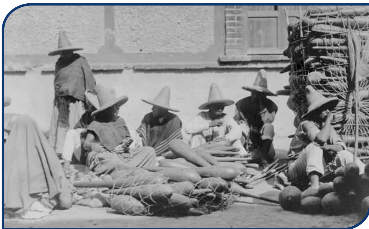
Venta de acocotes en Pachuca.

Debido a que la minería requería de materia prima, herramientas y maquinaria, el comercio se reactivó y la economía de Hidalgo se fortaleció. Actopan, Ixmiquilpan, Metztitlán, Tula y Tulancingo producían granos y hortalizas. De la Sierra y la Huasteca llegaba caña de azúcar y café. En el sureste se criaban borregos, cabras, vacas, caballos y mulas. El pulque de los llanos de Apan fue la bebida de mayor consumo al sur de nuestro estado y en ciudades importantes como México y Puebla.