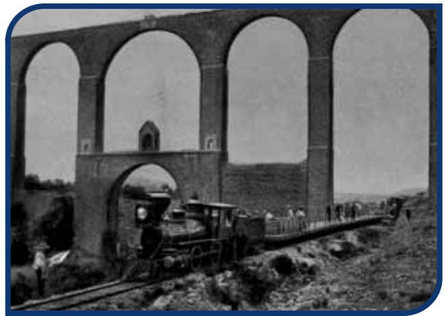
Ferrocarril de Hidalgo y del Nordeste, bajo los arcos de Tembleque.

Para impulsar el comercio se desarrolló el ferrocarril. Las estaciones ferroviarias en Huichapan, Tula, Pachuca, Apan y Tulancingo, permitieron a estas poblaciones comunicarse entre sí y con la Ciudad de México, el puerto de Veracruz y la frontera norte del país. El ferrocarril de Hidalgo y del Nordeste, propiedad de Gabriel Mancera (originario de Tulancingo), fue el único caso de empresa ferroviaria de capital nacional. A donde no llegó el ferrocarril, siguieron utilizando huacaleros, carretas, mulas, burros y caballos.