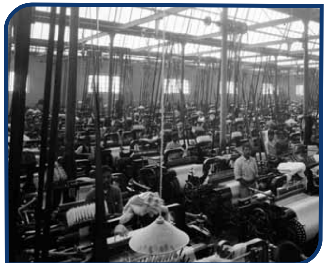
Fábrica de textiles.

Por el río Salado llegaban a Tula las aguas negras del valle de México, las cuales fueron usadas para producir electricidad y regar las áridas tierras del Valle del Mezquital.