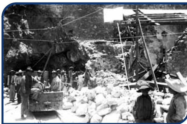
Entrada a la mina El Rosario, Pachuca.

En 1824, las minas de Pachuca y Real del Monte comenzaron a ser explotadas por ingleses. Al no obtener las ganancias esperadas traspasaron los derechos a una compañía mexicana en 1849. Los nuevos inversionistas obtuvieron grandes cantidades de dinero debido a la alta producción de plata. En 1906 una empresa estadounidense las empezó a explotar. En El Cardonal, Zacualtipán y Zimapán destacó la producción de hierro y plomo.