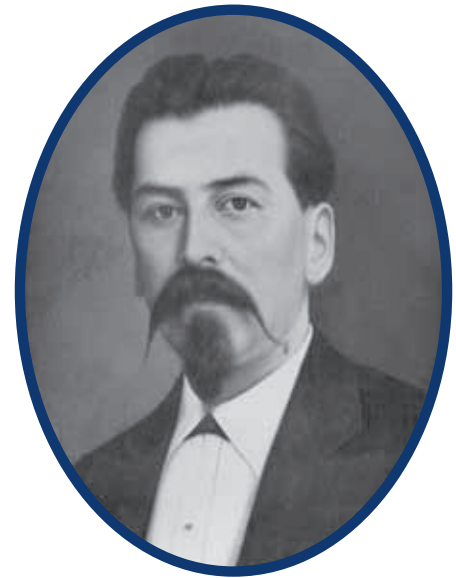
Gobernador provisional Juan C. Doria.

Los primeros dos gobernadores constitucionales fueron Antonino Tagle (1869-1873) y Justino Fernández (1873-1877); este último dejó el gobierno en 1876 cuando triunfó la rebelión de Tuxtepec que llevó a la presidencia de la República al general Porfirio Díaz.