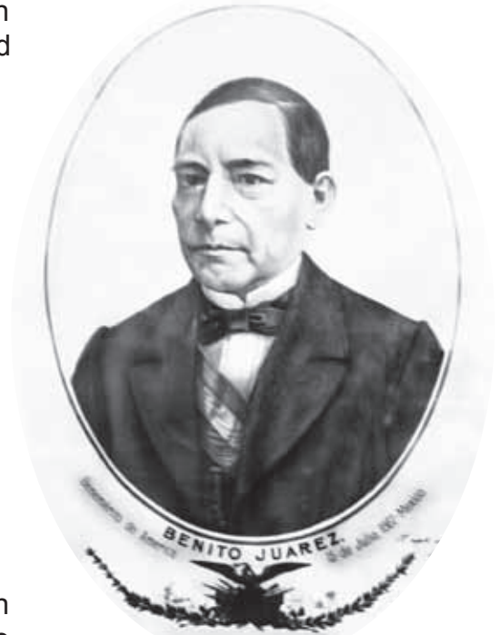
El presidente Benito Juárez.

La intervención y el imperio terminaron en 1867 con el fusilamiento de Maximiliano en la ciudad de Querétaro. Así quedó restablecido el sistema republicano y el gobierno encabezado por el presidente Benito Juárez.