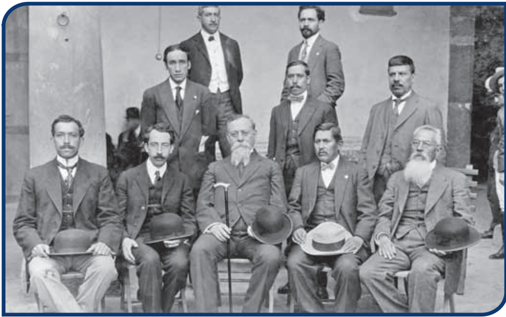
Diputados representantes del estado de Hidalgo al Congreso Constituyente de Querétaro con Venustiano Carranza, 1917.