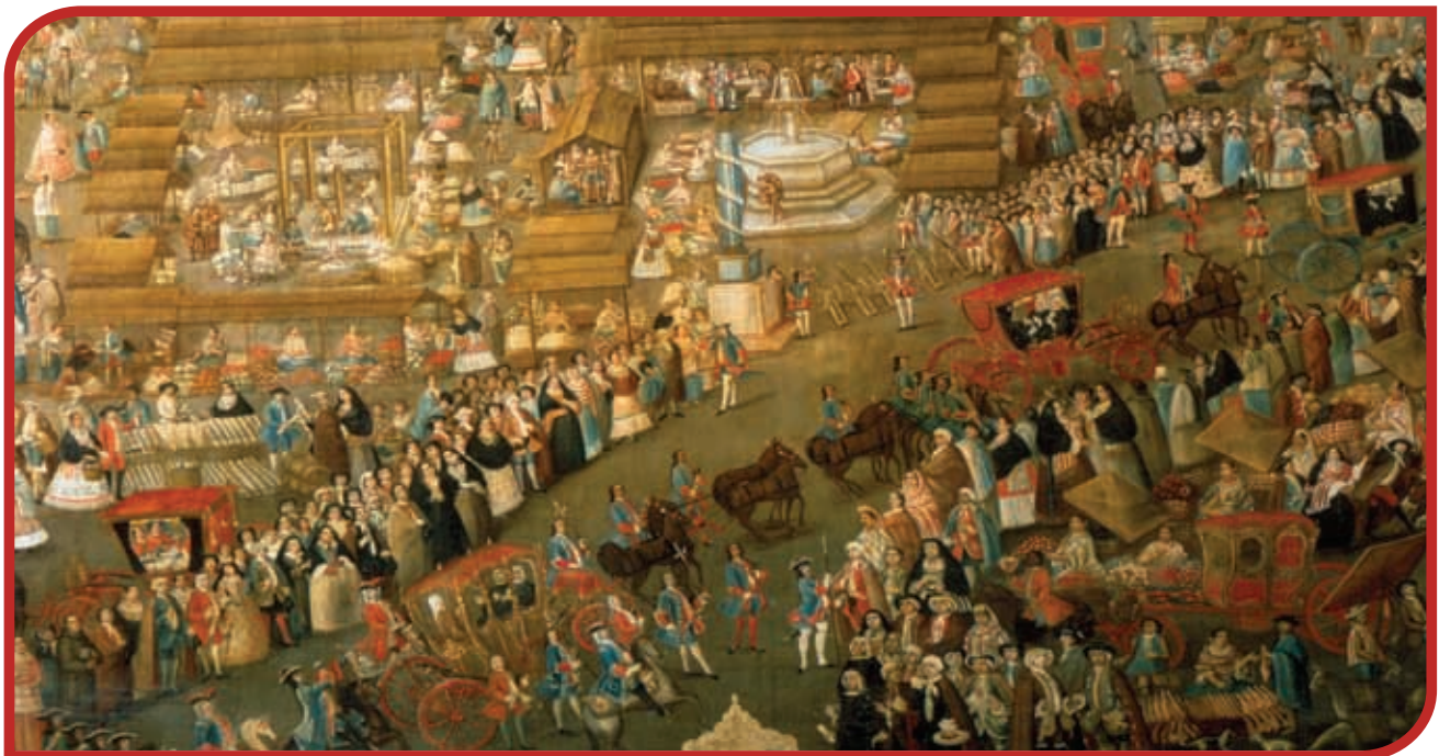
Un día en la plaza mayor.

Comparte con el grupo tu opinión sobre la imagen.