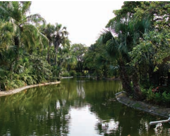
Parque Ignacio Manuel Altamirano, o “Papagayo”, Acapulco.