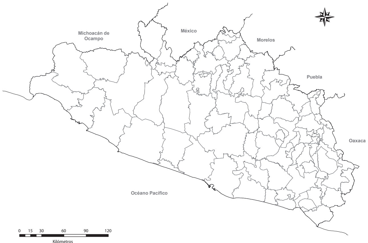
Regiones del estado de Guerrero.

Después de haber compartido tus ideas con tus compañeros de grupo sobre las reservas naturales que existen en nuestra entidad, redacta un texto de opinión o elabora una historieta acerca de lo que piensas sobre cómo seguir conservando estas reservas naturales que forman parte de nuestro patrimonio natural, localízalas y coloréalas en el siguiente mapa.