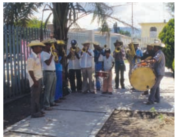
Banda de Tenexatlajco en Chilapa.

Cada región de nuestro estado se identifica con esta música: Acapulqueña, Alingolingo, Toro rabón, Sanmarqueña, Por los caminos del sur, Guerrero es una cajita, La iguana, Querreque, Zirándaro.