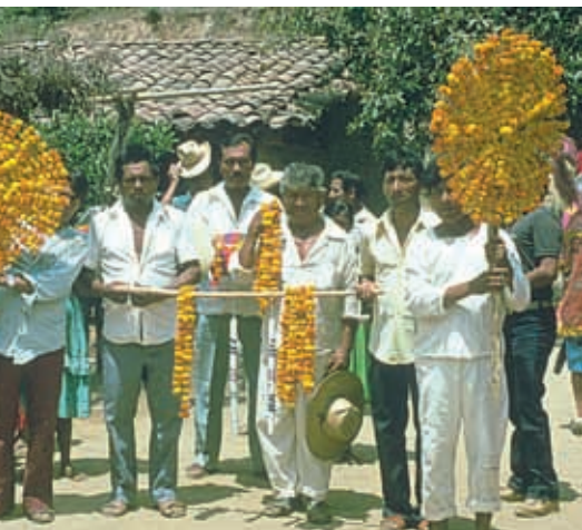
Tlapanecos de Azoyú.

La cultura de los guerrerenses está constituida por una gran diversidad de modos de vida, de identidades regionales, locales, grupales y étnicas. Forjada históricamente, en el contacto con los diversos entornos naturales que caracterizan a nuestro estado y en las luchas sociales. Esto es lo que constituye el patrimonio cultural del estado.