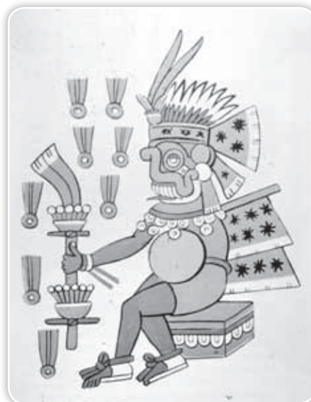
Nuestros antepasados indígenas le rendían culto a Tláloc, dios de la lluvia.

La visión del mundo que tenían nuestros antepasados prehispánicos los llevó a crear mitos, es decir, relatos en los que trataban de explicar el origen del género humano y de personajes extraordinarios como obra de seres sobrenaturales o dioses. Creían que esos dioses habían dado origen a su pueblo, que habían creado los animales y las flores, y también les habían enseñado la forma de alimentarse, vivir y comportarse. Trataban de representarlos por medio de esculturas, pinturas y tallados en roca tal como se los imaginaban. Además, construyeron hermosos templos y santuarios en su honor.