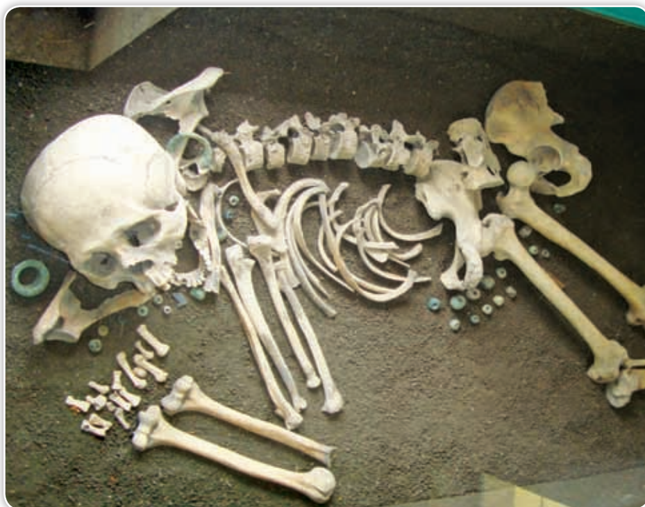
Restos de un entierro encontrado en Chalcatzingo. Se pueden apreciar los adornos y otros objetos que acompañaban al difunto.

Cuando las personas morían, nuestros antepasados también realizaban ceremonias; acostumbraban enterrarlas acompañadas de ricas ofrendas de alimentos y figurillas de barro o cerámica. Les colocaban, además, adornos que podían ser de oro, jade , obsidiana u otros materiales, de acuerdo con la clase social a la que pertenecía el difunto.