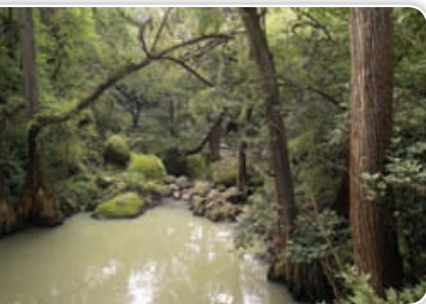
Pozo de Quetzalcóatl, en Amatlán.

Una de las leyendas más conocidas en Morelos es la de Tepoztécatl, dios del pulque, concebido por una joven y el dios Ehécatl, que tomó forma de colibrí. La leyenda narra cómo desde niño Tepoztécatl tuvo