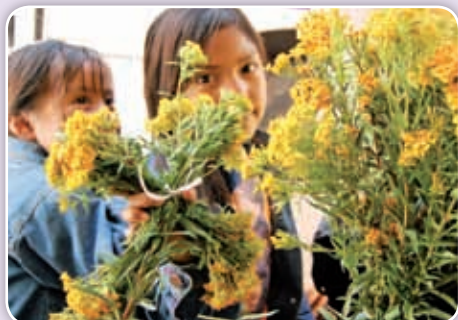
Flor de pericón.