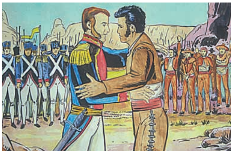
Abrazo de Acatempan.

¿Qué opinas de la actitud de Vicente Guerrero frente a la de su padre?