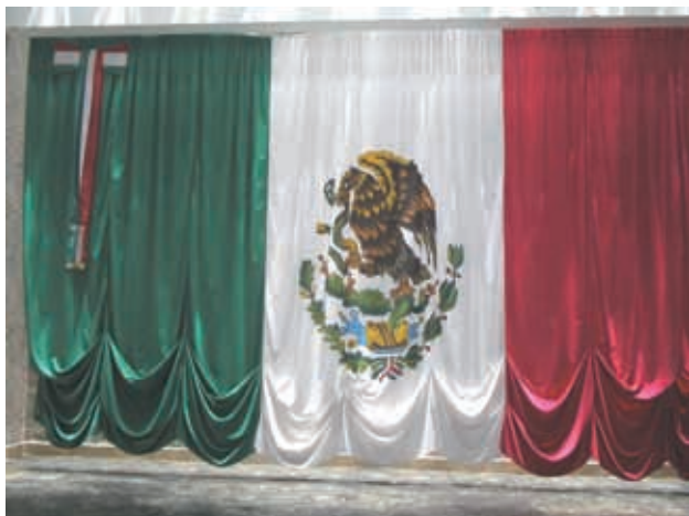
Museo de la Bandera, en Iguala.

En la ciudad de Iguala, Vicente Guerrero aceptó un escrito redactado por Iturbide, al que se llamó Plan de Iguala. En él acordaron unir sus fuerzas para consumar la Independencia de México. El 27 de septiembre de 1821, Iturbide entró a la ciudad de México al frente del Ejército de las Tres Garantías, cuyo lema era: "Independencia, Religión y Unión".