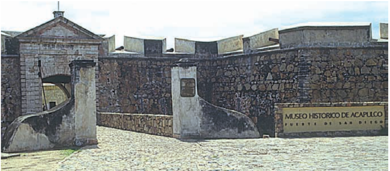
Fuerte de San Diego, ubicado en la ciudad de Acapulco de Juárez.