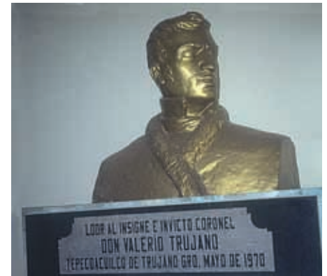
Monumento a Valerio Trujano en Tepecoacuilco.

Militar y político, que se enfrentó a Santa Anna, Iturbide y Bustamante en defensa de la república federal. En 1850 fue gobernador del estado de Guerrero, al que logró sustraer de la dictadura de Santa Anna. Fue presidente de la República de octubre de 1855 a septiembre de 1856. Poco después, luchó contra Maximiliano y la presencia francesa.