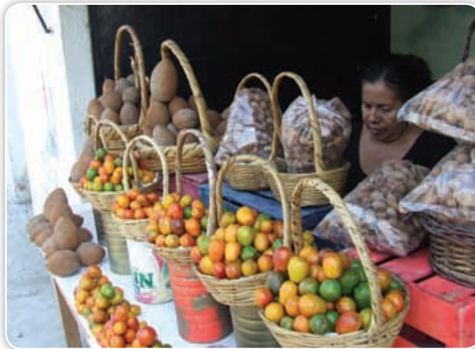
La comercialización de frutos de la región es una de las actividades que realizan los pobladores de Coatlán del Río.

y campos de cultivo, así como a los sitios de interés turístico y culturales que se pueden visitar: el lago de Tequesquitengo, los ojos de agua de Cuauchichinola, los lagos del Rodeo y de Coatetelco o la zona arqueológica de Xochicalco.