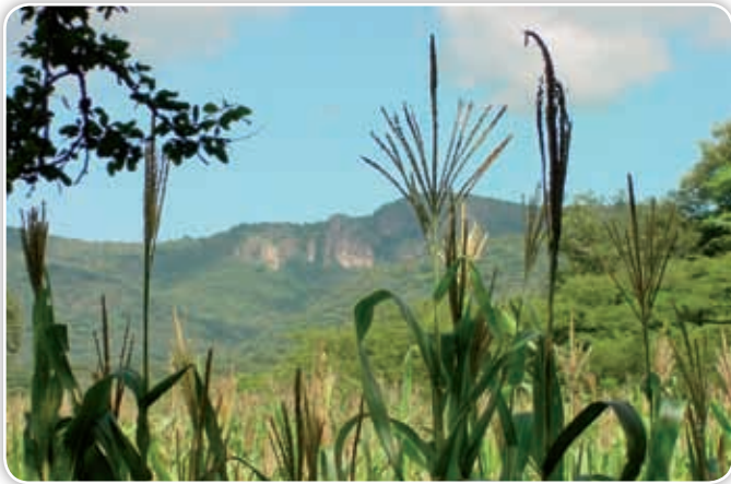
Aspecto de la región de los valles, donde principalmente se cultiva maíz.

¿Piensas que tu municipio es importante? ¿Por qué?