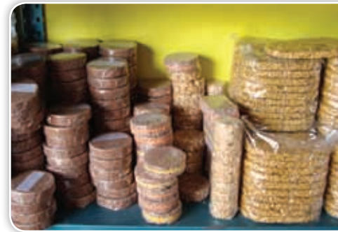
El municipio de Temoac, del oriente de Morelos, se distingue por la producción de dulces de amaranto.

Costumbres que algunos pueblos tienen de nombrar cada año, entre sus habitantes, a un mayordomo. Éste es el encargado de planear, organizar y administrar la fiesta religiosa de la comunidad.