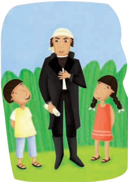
En honor a las acciones heroicas que realizó José María Morelos, nuestra entidad lleva su nombre con orgullo.

La cercanía de Morelos con otros estados influye para que nos relacionemos con los pobladores de estos lugares en actividades comerciales y turísticas, pero también para que convivamos en festividades religiosas y tradicionales. Mantener el trato amable y respetuoso entre vecinos permite resolver cualquier dificultad cuando hay duda sobre los límites que los separan en algún lugar.