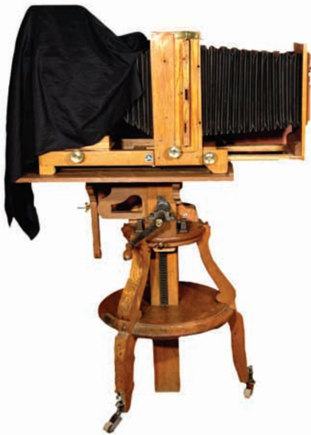
Cámara fotográfica utilizada por Romualdo García.

La modernidad del Porfiriato permitió la llegada de nuevos inventos que cambiaron la forma de comunicación entre los habitantes de Guanajuato. El teléfono permitió a las personas hablar y escuchar sin estar cerca o viéndose cara a cara, aunque los separara una gran distancia.