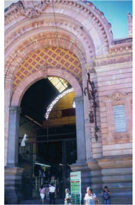
Durante el Porfiriato se construyeron mercados para facilitar el comercio.

Las personas se interesaron por imitar modas extranjeras y demandaron artículos que veían en revistas y que era necesario importar a nuestro país, pues aquí no se elaboraban. El comercio local se benefició con la construcción de mercados públicos que facilitaron las compras por su orden y limpieza. Como ejemplo, se puede admirar el mercado Hidalgo en la ciudad de Guanajuato; también se construyeron otros en diferentes municipios.