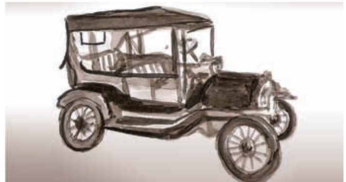
Los automóviles llegaron al estado de Guanajuato y facilitaron el transporte.