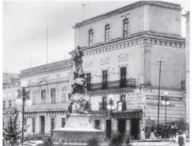
El alumbrado público de algunas ciudades de Guanajuato se instaló a principios del siglo xx.