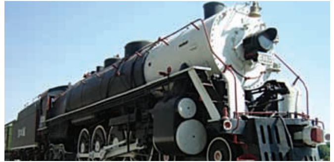
Los ferrocarriles fueron un medio de transporte muy importante en Guanajuato.

Otros medios de transporte que llegaron a Guanajuato durante el Porfiriato fueron el automóvil y los tranvías; estos últimos eran vagones que se movían sobre rieles dentro de las ciudades, ya fueran jalados por animales o con energía eléctrica. Estos transportes permitieron a las personas moverse más rápido.