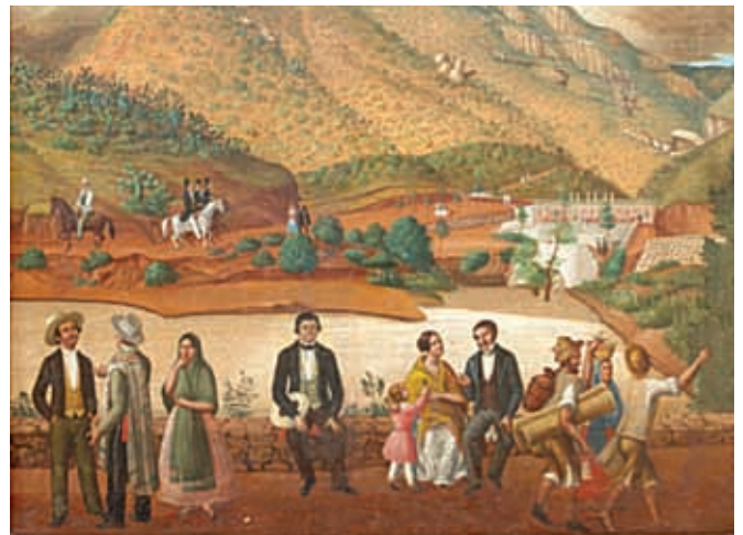
En la época virreinal, las personas se divertían en los paseos.

Durante el Virreinato, los guanajuatenses se distraían con los pasatiempos de mesa. Les gustaban los juegos de cartas como el tresillo, tiraban los dados o jugaban ajedrez, escuchaban a las bandas y grupos de música tocar en los jardines públicos y se organizaban bailes y comidas. Acostumbraban dar paseos en carretas, a pie o a caballo, asistían a funciones de teatro, corridas de toros o peleas de gallos. Hacían en sus casas reuniones llamadas tertulias , para escuchar la interpretación de algún instrumento musical o para disfrutar de la lectura en voz alta. Organizaban paseos al campo para comer al aire libre. Les gustaba asistir a las ferias; como ya se mencionó, eran muy importantes las de León y Celaya. Como no había alumbrado público, las calles eran oscuras y muy inseguras. Por eso, las personas se acostaban a dormir temprano y las calles lucían desiertas. Sólo el sereno acostumbraba pasear por éstas acompañado de su farol, alumbrando el camino, y si no encontraba ninguna cosa extraña, gritaba “todo sereno”; de esta manera, las personas sabían que la ciudad estaba en calma.