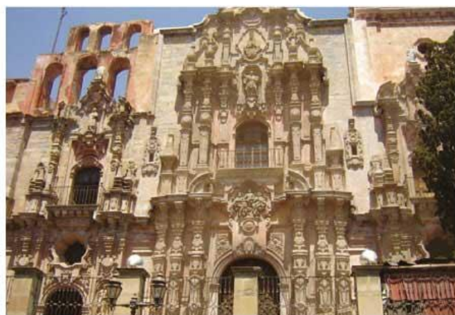
Templo de la Compañía en Guanajuato.

Otro estilo artístico que predominó en el estado al final de la época virreinal fue el neoclásico, caracterizado por la ausencia de adornos y la sencillez de las construcciones, como se puede apreciar en la Alhóndiga de Granaditas, construida durante el gobierno del intendente José Antonio de Riaño, a principios del siglo XIX.