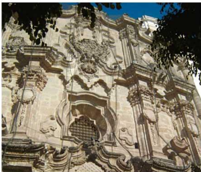
Templo de los Ángeles en León.

El estilo artístico que predominó durante la época virreinal en Guanajuato fue el barroco, que se caracterizó por los muchos adornos en las construcciones y el uso de columnas. Sobresalen edificios como el templo de la Compañía y la iglesia