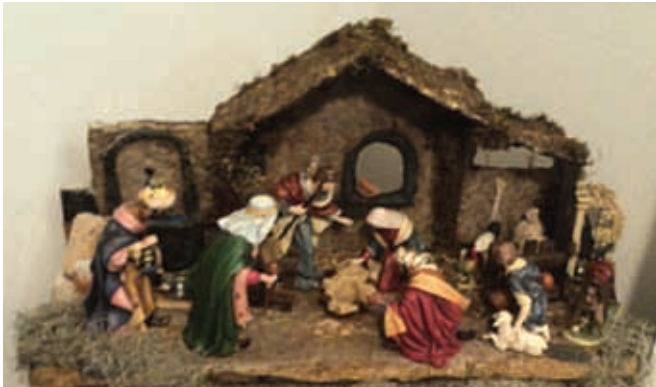
En el estado de Guanajuato hay muchas tradiciones como los nacimientos.

En las fiestas religiosas se festejaba a algún santo o santa. Era costumbre hacerlo con misas, lanzar juegos pirotécnicos, ofrecer comida, ya fuera para venta o regalada, y se escuchaba música;