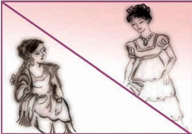
Las costumbres coloniales influyeron en la forma de vestir de las mujeres.

El vestido es otro aspecto importante de la época virreinal. La clase social de las personas determinaba el tipo de ropa que podían usar. Los españoles y criollos usaban ropa cara y muy adornada; los indígenas estaban acostumbrados a usar ropa que ellos mismos elaboraban en