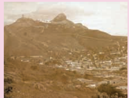
El Cerro de La Bufa se puede ver desde la ciudad de Guanajuato.

Cuenta la leyenda que en el pintoresco y bello cerro de La Bufa habita una princesa encantada muy hermosa. En la mañana de cada uno de los jueves festivos del año, sale al encuentro de un caminante varón, pidiéndole que la lleve en brazos hasta el altar mayor de la que hoy es la basílica de Guanajuato, y que al llegar a ese sitio renacerá la ciudad encantada, toda de plata, que fue esta capital hace muchos años, y que ella, la joven del hechizo, recobrará su condición humana.