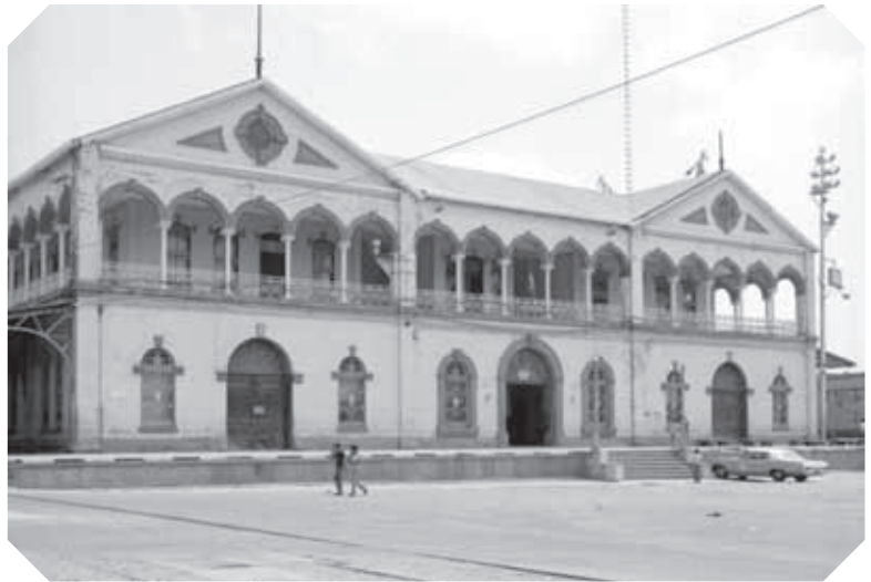
▲ Estación ferroviaria en Tamaulipas a finales del siglo XIX.

Estos cambios repercutieron en Tamaulipas, pues los paisajes cambiaron. Los grupos nómadas desaparecieron y se dedicaron a trabajar en las haciendas o en las minas, y a los antiguos cultivos se les sumaron el de ixtle y el de henequén, en la región de la Sierra Madre Oriental y los alrededores de Ciudad Victoria, que luego se vendían a los talleres de jarcería en Tula. En la región de San Carlos una compañía estadounidense extraía de las minas cobre, oro y plata.