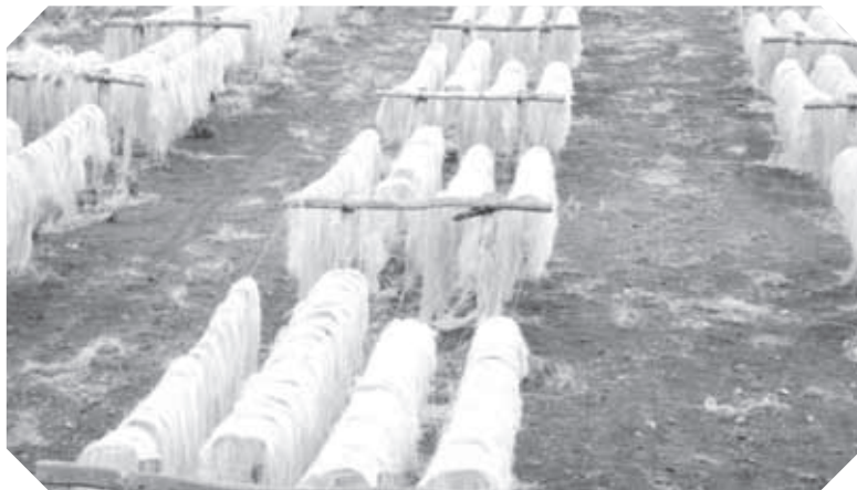
▲ Plantación henequenera tamaulipeca durante la Revolución Mexicana.

En 1880, el gobierno de Tamaulipas permitió que la compañía Waters Pierce Oil Company instalara una torre y maquinaria para extraer petróleo en Árbol Grande, cerca de Tampico. En la Sierra de San Carlos se activó la minería, pero en 1907 se detuvo y así estuvo un par de años, debido a una crisis.