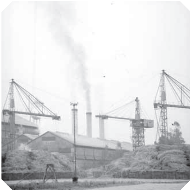
▲ Ingenio azucarero en Xicoténcatl.

En 1848, el río Bravo se convirtió en frontera; se fundaron nuevos puertos, como Bagdad, cerca de Matamoros. Ciudades como Reynosa, Nuevo Laredo y especialmente Matamoros crecieron debido al comercio con Estados Unidos. El gobierno mexicano intentó obligar a los tamaulipecos de la frontera a pagar más impuestos, lo que en 1851 provocó la llamada rebelión de la Loba. Los rebeldes defendían el comercio entre ambos lados del río Bravo. En 1861, el presidente Juárez atendió a los comerciantes fronterizos por lo que Matamoros se convirtió en zona libre.