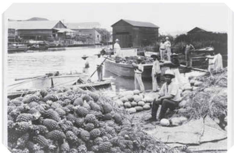
▲ Mercado en la costa, finales del siglo XIX.

En los puertos tamaulipecos se establecieron oficinas llamadas aduanas en las que se cobraban aranceles . En caso de guerras, los enemigos las disputaban para comprar armas, comida y pagar a los soldados.