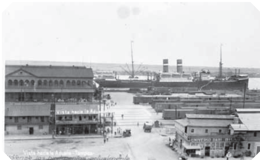
▲ Aduana de Tampico en 1920.

A partir de la Independencia, los puertos de Matamoros (antes Congregación El Refugio), Soto la Marina y Tampico, se fundaron en 1826 y se volvieron más importantes, se activó el comercio marino y por Tamaulipas pasaban muchos productos que después llegaban a Nuevo León, Coahuila, Durango y Zacatecas. En esos puertos se construyeron grandes edificios que contrastaban con la apariencia de otras poblaciones tamaulipecas.