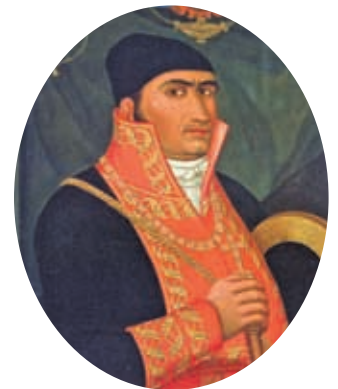
▲ José María Morelos y Pavón (1765-1815).

El 27 de septiembre de 1821, Iturbide, al mando del Ejército Trigarante, entró triunfante a la ciudad de México.