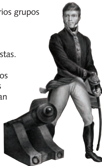
▲ Francisco Javier Mina (1789-1817).