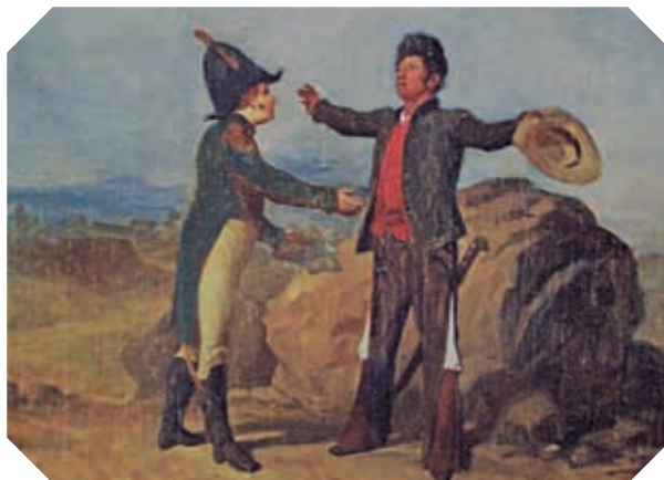
◀ Iturbide y Guerrero en el conocido Abrazo de Acatempan, 1821.

Busca los mapas de Nuevo Santander durante ese periodo y cuáles fueron los sucesos más importantes.