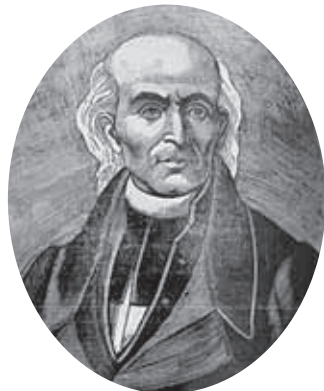
▲ Miguel Hidalgo y Costilla (1753-1811).