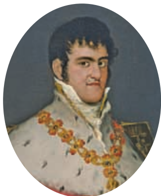
▲ Fernando VII fue hijo de Carlos IV y fue rey de España durante pocos meses en 1808, y luego desde 1814 hasta la muerte, ocurrida en 1833.

Primero lucharon por el derecho a gobernarse a sí mismos y luego porque Nueva España formara un nuevo país, independiente de España. Miguel Hidalgo y Costilla fue el principal personaje de este movimiento, junto con Ignacio Allende y Juan Aldama. Ellos proclamaron un movimiento armado que comenzó la madrugada del 16 de septiembre de 1810.