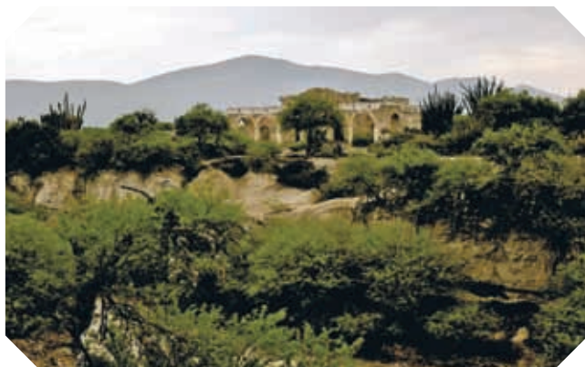
▲ En Tula se libraron importantes batallas durante la guerra de Independencia.

El movimiento de Independencia se extendió por Nuevo Santander en 1810. En ese año los seguidores de Hidalgo tomaron la ciudad de San Luis Potosí. La noticia animó a los habitantes de Tula a unirse a la guerra.