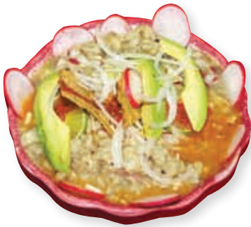
Diversos platillos típicos caracterizan las regiones de Michoacán. En la Región Oriente es famoso el pozole.