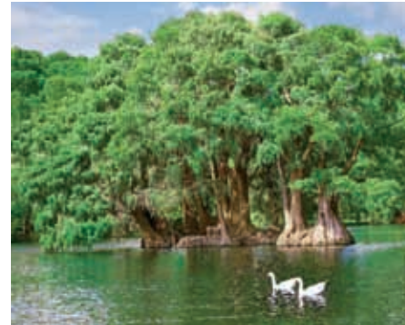
Lago en Zamora.

De relieve montañoso y clima templado, es la región más importante en la producción de aguacate. Aunque su principal actividad económica es la agricultura, alberga a la segunda ciudad más poblada de la entidad: Uruapan. En las zonas urbanas predominan las actividades industriales y de servicios, pero en la región coexisten pueblos de famosa tradición artesanal, por ejemplo, Paracho destaca por la elaboración de guitarras.