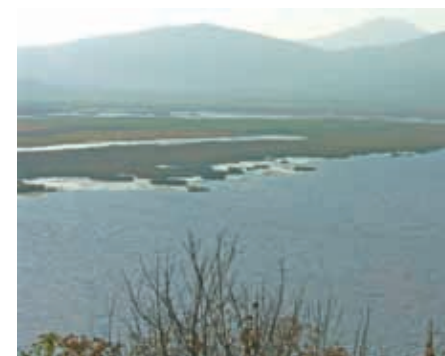
Lago de Pátzcuaro.